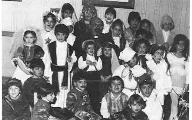
Սրբազան Հայրը, տարազահանդէսիմ մասնակցող մանուկներու հետ միասին

մէկ պիտի բարձրանան սրբազան լերան կատարին եւ աղաղակեն՝ «Ահաւասիկ սրբազան լեռ մենք հասանք, հասանք քու կատարիդ»: