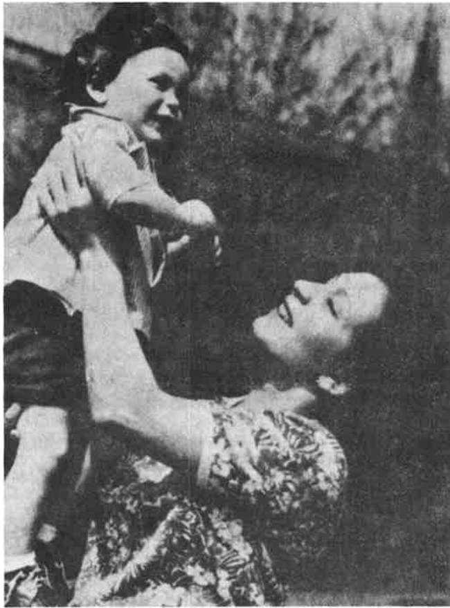
«Լսի՛ր, որդի՛ս, պատգամ որպէս ...»