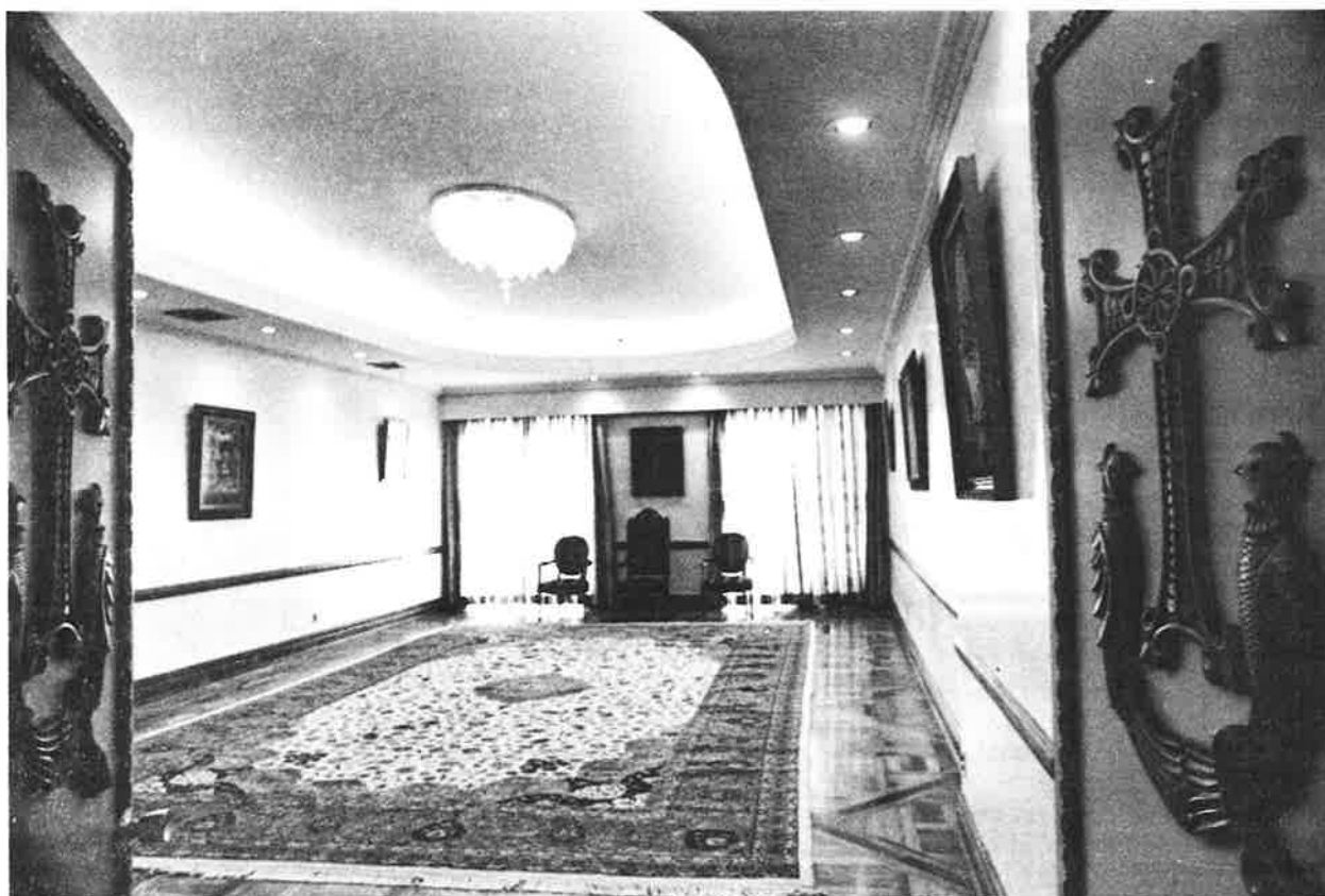
The new Reception Hall