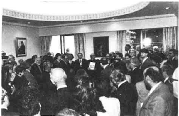
Սրբազան Հայրը իր շնորհակալութեան խօսքը կ'ուղղէ ներկաներուն

The weekend of May 1st and 2nd brought to culmination ten months of intense work in the renovation and refurbishing of the Prelacy headquarters in New York City. The Executive Council, implementing the decision of the 1986 N.R.A., started the Prelacy Renovation Project in late July of 1986. We are all gratified that it was completed in ten months, totally changing the look of our Prelacy. The alterations were accomplished with style and good taste. It was particularly pleasing to observe visitors' reactions: the dark red granite entry, the facade with "Prelacy of the Armenian Apostolic Church" announced proudly in English and Armenian lettering, plus the insignia of the Prelacy, bestowing a sense of grandeur over all. Inside, the spacious new offices on the ground floor, the inviting bookstore, the offices of AREC and ANEC, the Shnorhali Library and the up-to-date computer equipment room, afforded the building a business-like atmosphere. But the greatest surprise was the Reception Hall, with its magnificent crystal chandelier, the Kirman carpet of royal proportions and the oval shaped ceiling decorated with an haut-relief frieze. Pride in the new Prelacy was expressed by many, in a variety of joyful ways.