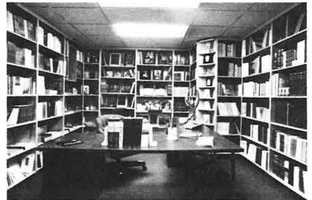
The New Bookstore