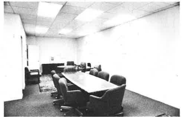
St. Nerses Shnorhali Library