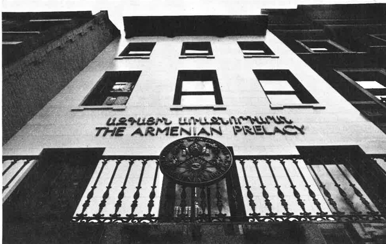
The North Facade of the Prelacy

“OUR ADDRESS IS THE SAME, BUT WE HAVE CHANGED !!!”