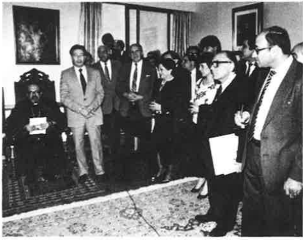
The Chairman of the Executive Council welcomes the guests.