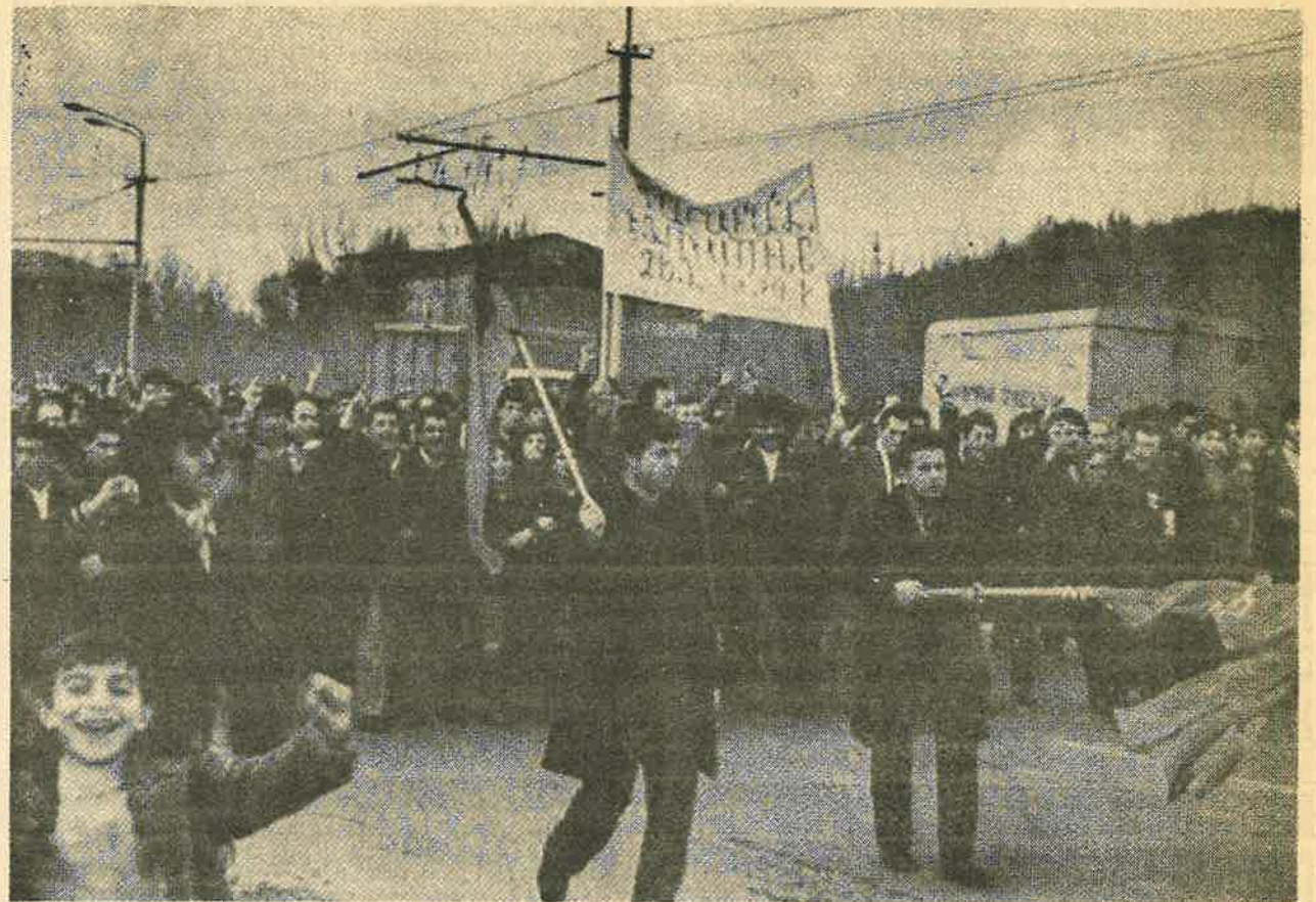
Armenian demonstrators in Etchmiadzin. The banner reads: Gorbachev, Etchmiadzin is with you.