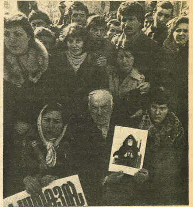
A group of Armenian demonstrators

A grandmother in Yerevan recalls: "It was a week of craze and partying. Just as on May 8, 1945, total