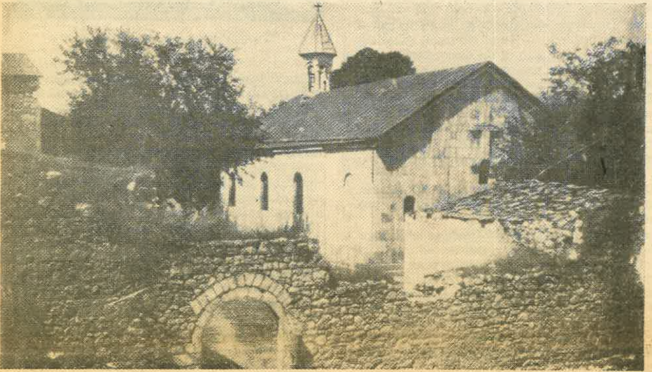
Ամարասի վանքի ընդհանուր տեսարանը.

Մամիկոնեանի մարզպանութեան տիրացումը: Օգտուելով Պարսից իշխանութեան տկարացումէն ու վարած նոր քաղաքականութենէն, 5-րդ դարու վերջաւորութեան Արցախի առանձնահիկ իշխանական տունը կ'ըստեղծէ անկախ թագաւորութիւն: Այս շրջանին Արցախը կ'ապրի մշակութային եւ ստեղծագործական հարուստ կեանք եւ վերելք: Դժբախտաբար սակայն շուտով կ'ըսկսին մնայուն բախումներ նախ պարսից հետ եւ ապա ներխուժող Պաղարներուն, որոնց հետեւանքով շրջանը լրջօրէն տկարացաւ եւ աւելի ուշ 7-9-րդ դարերուն արաբական բռնապետութիւնն ու անոր հետեւանքները աղէտալի դարձան: Արաբական տիրապետութեանց յաջորդեցին Մոնղոլ-թաթարական եւ թրքական Գարա Գոյուլու եւ Ազ Գոյունլուններու արնշղմէլ աւառարումներն ու ներխուժումները, որոնց դիմաց Արցախը հերոսաբար պայքարեցաւ, այլ սակայն մարդկային կորուստներն ու դուրսէն հրահրուած ներքին երկպառակութիւնները պատճառ դարձան որ 9-րդ դարուն վերջերուն Արցախի թագաւորութիւնը տկարացած բաժնուի երկու ճիւղերու (Պաշենցիներ