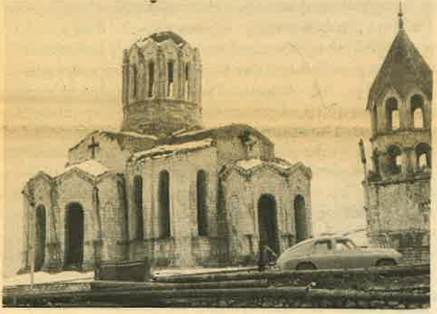
Շուշիի Ղազանչոց եկեղեցին

Տասնեակ դէպքերից միայն մի քանիսը թուենք,