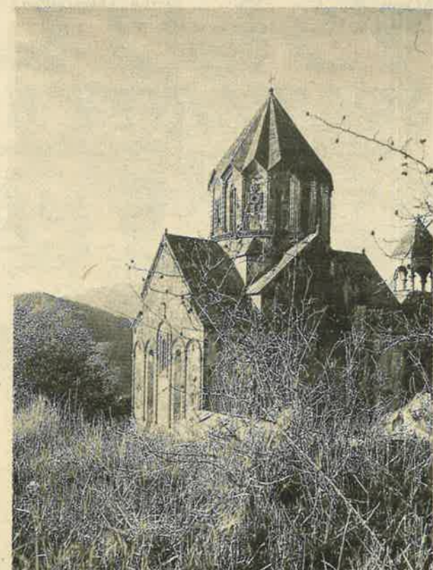
Գանձասարի Ս. Յովհ. Սկրտիչ եկեղեցին Գանձասարը եղած է կաթողիկոսամիստ վայր՝ մինչեւ 1815 թ.

դրութեամբ կրնայ գոյատեւել, այլապէս մահմետական զանգուածը կրնայ գէշ կերպով տրամադրուիլ սովետական կարգերուն դէմ: Այնուհետեւ շրջանէն ներս տեղի կ'ունենան տխուր միջադէպեր ու սպանութիւններ մինչեւ 1975 թուական: Ղարաբաղցիք կ'ենթարկուին