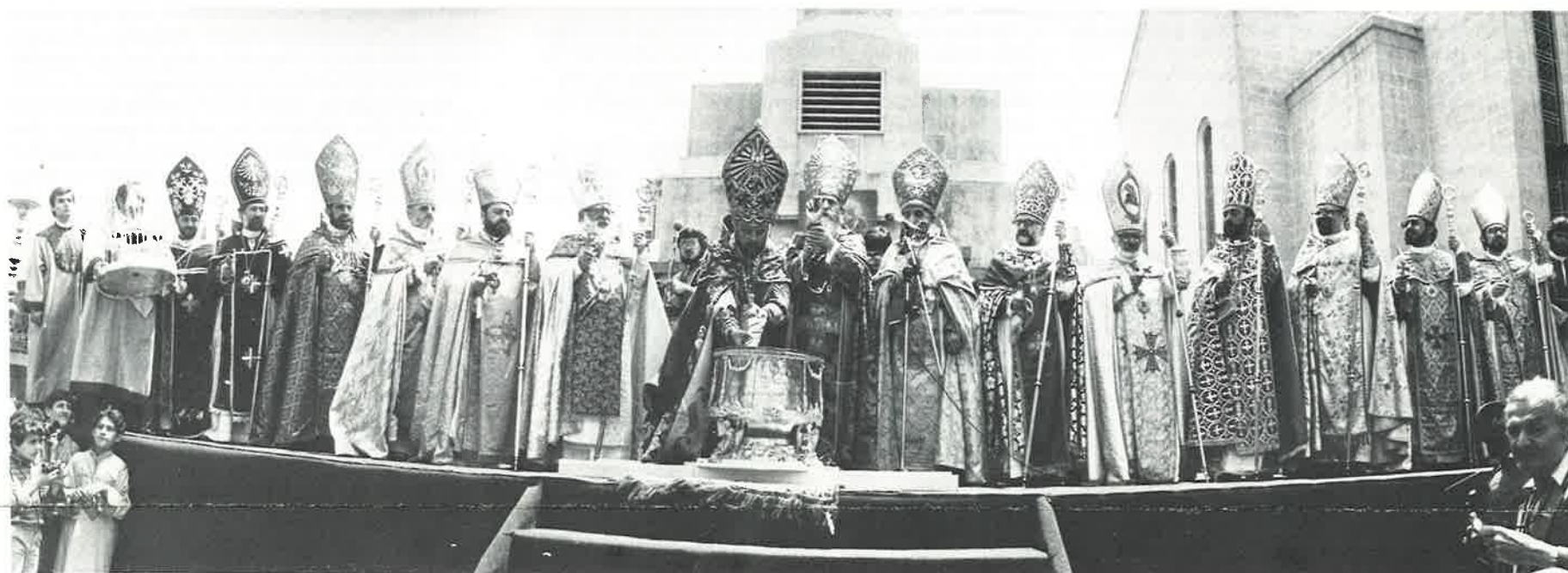
His Holiness Karekin II stirs the old Muron with the new using the relic of St. Gregory's righthand.