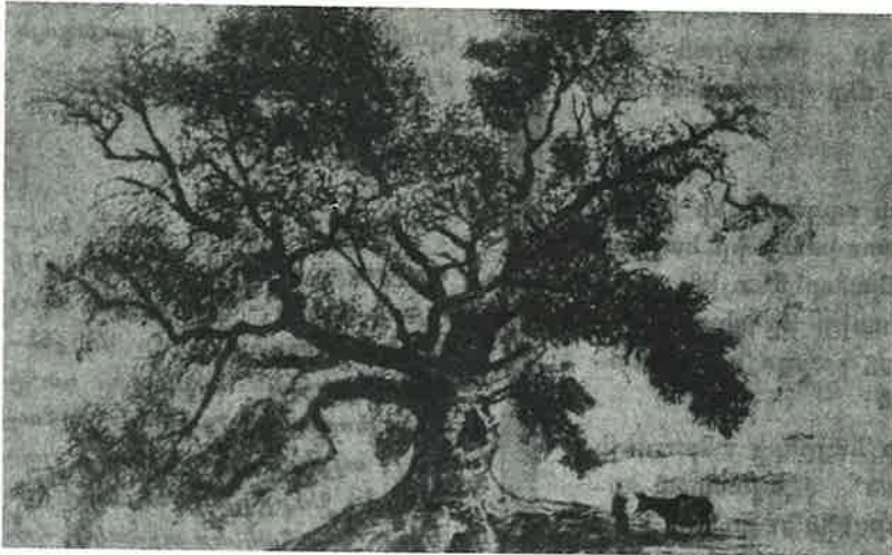
Ըստ աւանդութեան՝ Վարդան Մամիկոնեան այս ծառը տնկած է 450 թուին...