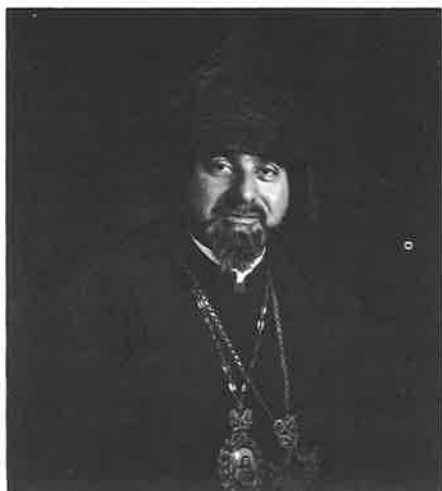
His holiness Catholicos Karekin II of the Holy See of Cilicia

He served the United States and Canadian communities for nearly four years. It was during this time that the Armenian community he served became acquainted with their youthful Prelate who was destined for a position of greater leadership. His election and consecration as Catholicos-Coadjutor took place in Lebanon in May, 1977, amidst much jubilation.