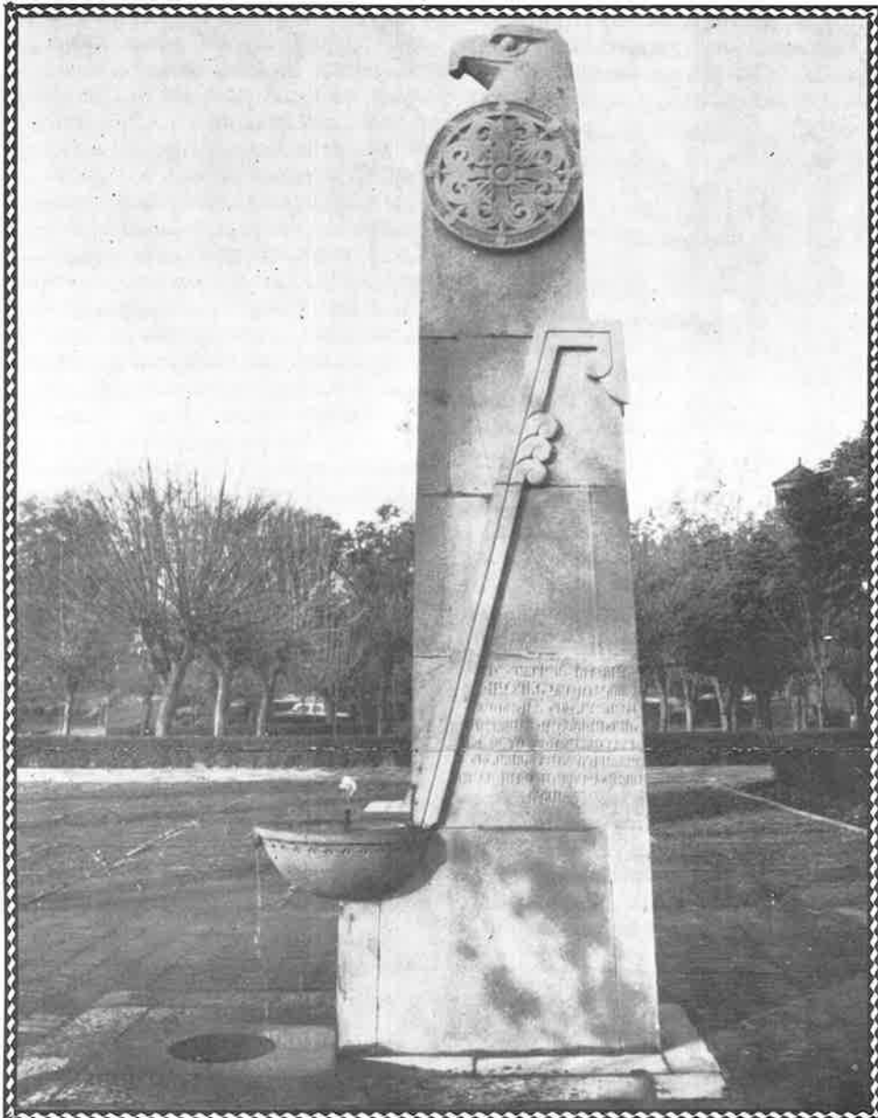
ԽՐԻՄԵԱՆ ՀԱՅՐԻԿԻ ԱՂԲԻՒՐ-ՅՈՒՇԱՐՁԱՆԸ Ս. ԷՋՄԻԱՇՆԻ ՄԷՋ (Եւ այս առթիւ՝ Վազգէն Ա. Կաթողիկոսի պատգամէն հատուածներ)

On October 12, 1982, His Holiness Vazken I inaugurated the above monument dedicated to Khrimian Hairig, Father of Armenian National Consciousness. In his famous speech at the Berlin Conference (1878), Khrimian Hairig referred to the "paper ladle" which symbolized the suppression of the Armenian nation and which has since become a legend for all Armenians. The above monument depicts the "iron ladle" now a drinking fountain, affirming our up-welling hope and commitment to freedom.