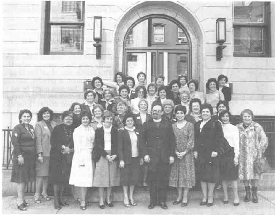
Համագումարի մասնակից հայուհիները Առաջնորդ Սրբազան Հոր հետ միասին

Արայանեան ծանօթացուց ներկաները եւ գնահատեց իրենց զոհողութիւնը ընդհանրապէս եւ մասնաւորաբար այս օրը տրամադրելու սիրօժար ոգին հակառակ իրենց բազմազգաղ գործունէութեան շրջանը ըլլալուն: