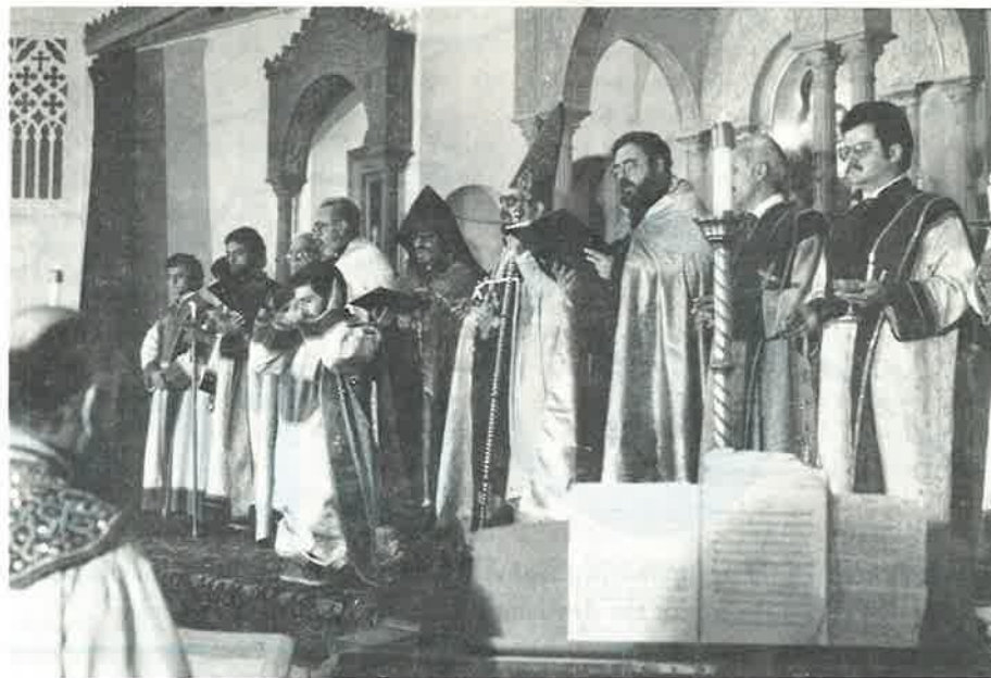
«Աստուածային եւ երկնաւոր շնորհ» . . . պահ մը՝ ձեռնադրութեան կարգէն