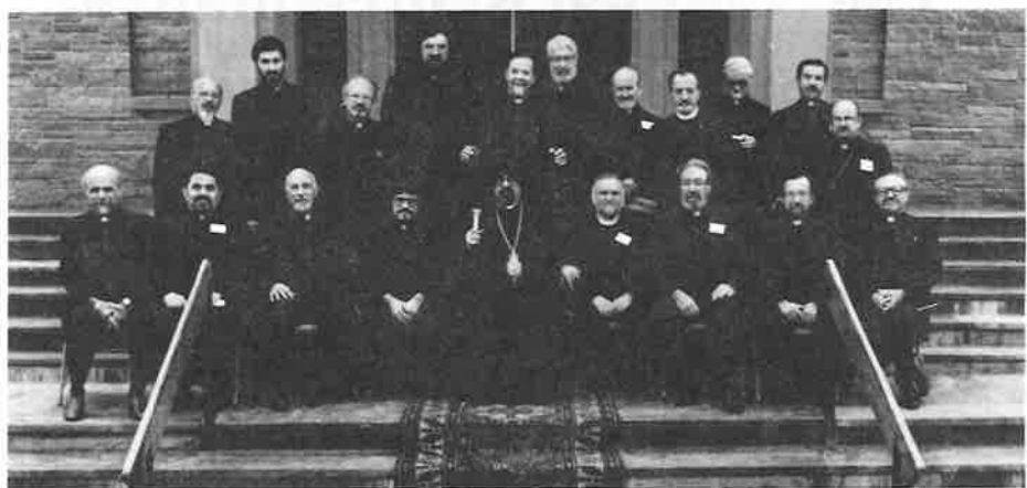
Թեմիս Հոգեւորականաց դասը Ուոթերթաունի Ս. Ստեփանոս Եկեղեցւոյ մուտքին

diaspora life of the American-Armenians, and urged them to continue their loyal support of the See of Cilicia, an institution that has been so instrumental in the formation of the Prelacy community. In discussing church unity, His Grace paraphrased one of the greatest presidents of the United States of America, Abraham Lincoln, who one hundred and twenty years ago, in his second State of the Union Message said: "We cannot escape history. We of this Assembly will be remembered in spite of ourselves. The trial through which we pass will light us down in honor or dishonor to the latest generation. Let it be said of us that we, too did not fail: that we, too, worked together, to bring our church through difficult times."