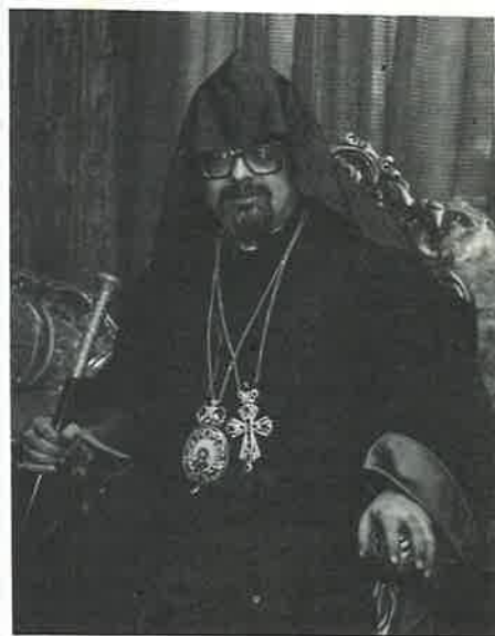
Գերաշնորհ Տ. Մեսրոպ Եպսկ. Աշնեան Առաջնորդ Ամերիկահայոց Արեւելեան Թեմի Նիւ Եորք:

Ապա ներկայաներ մօտեցան Հայրապետին եւ ներկայացուցին իրենց շնորհաւորութիւնները: