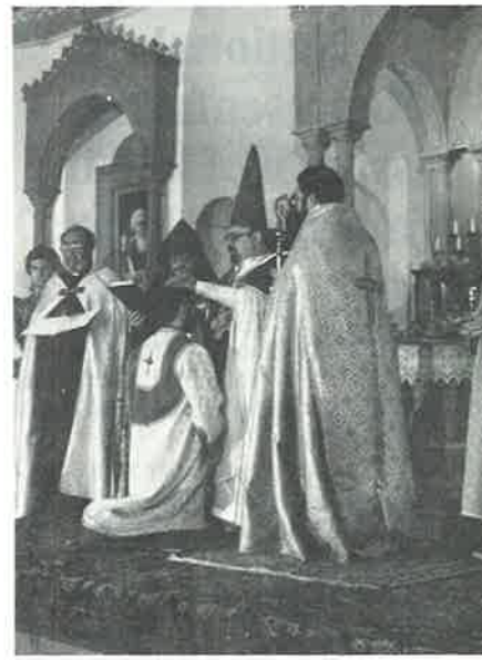
Ձեռնադրութեան պահը: «Ես դնեմ ձեռսի վերայ սորա եւ դուք ամենեքեան աղօթաւ արարաք» . . .

Օրուան իր աւուր պատշաճի խօսքին մէջ, ձեռնադրիչ Սրբազան Հայրը նախ շեշտեց, արդի կեանքին եւ սփիւռքա-