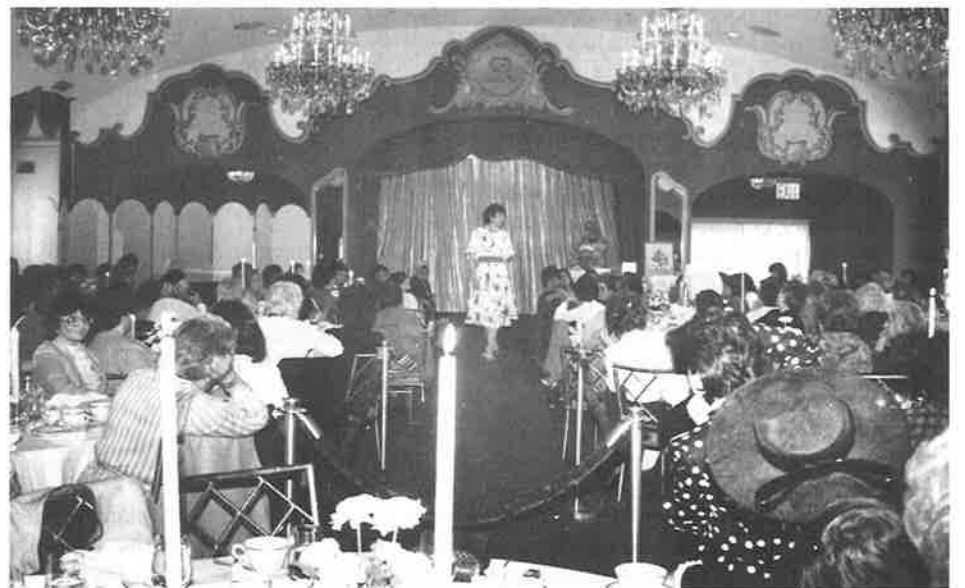
Guests enjoying the Fashion Show