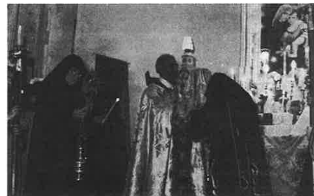
The Kalfayan Orphanage which has been known by this name since 1866, is run by the Kalfayan Orders' nuns. In this picture you can see an Armenian nun during the Offertory of the Divine Liturgy. On the left we see another nun with the censor and a young girl as candle bearer.

It should be said that members of the diaconate are fully ordained ministers ( pashtonyay ) of the church. They may conduct services, baptize, marry and bury, but since they are not priests they cannot celebrate the eucharist. That deaconesses were not in minor orders, as some have claimed, but members of the clergy is indicated by the circumstances that they were ordained by bishops, by a rite similar to that for the ordination of men, and they were subject to the bishop's court. Deaconesses served in the orthodox churches until the 12th century. The order was revived by the Maronites in Lebanon in the 18th century, and by the Roman Catholics earlier this century. But the church of Armenia, which had women ministers until their demise as a consequence of the action of the Ittihad party during the first World War, has forgotten that they ever existed.