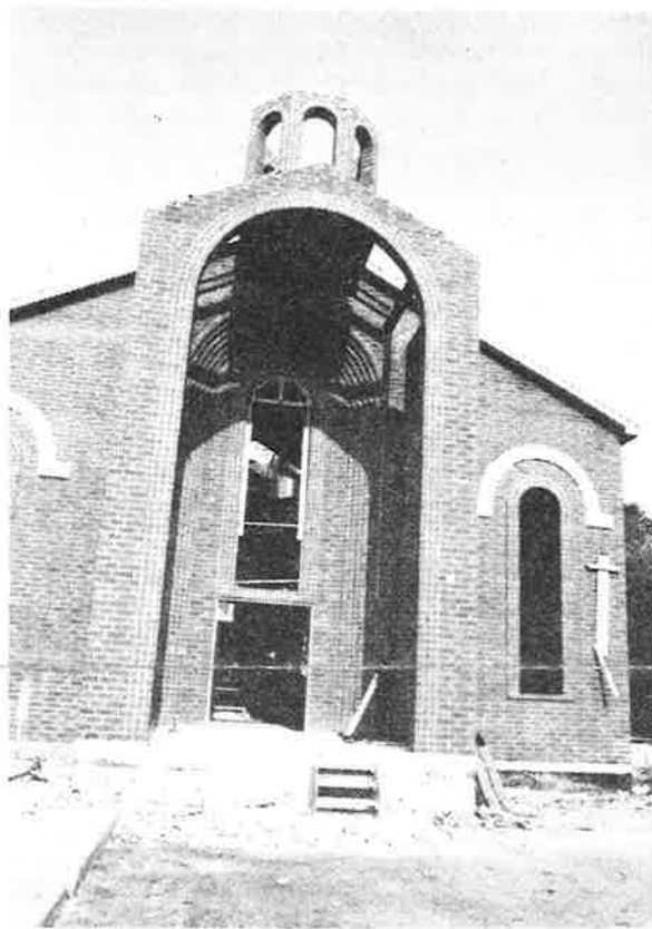
All Saints Church — Chicago, Ill. Height — Approx — 60' Cappacity — 300 Main Sanctuary 100 Balcony 7 Classrooms in lower level Traditional Design Cupola — Brick Bell tower over entrance — Brick construction Stained glass windows Main Altar & 2 Side Altars

MAIN HALL (CHADRJIAN HALL) Capacity — 300 TO 350 One Big Dome, two twin towers Ample parking lot Landscaping Garden(s) One main Khoran and two small in corners with Baptismal "Avazan"