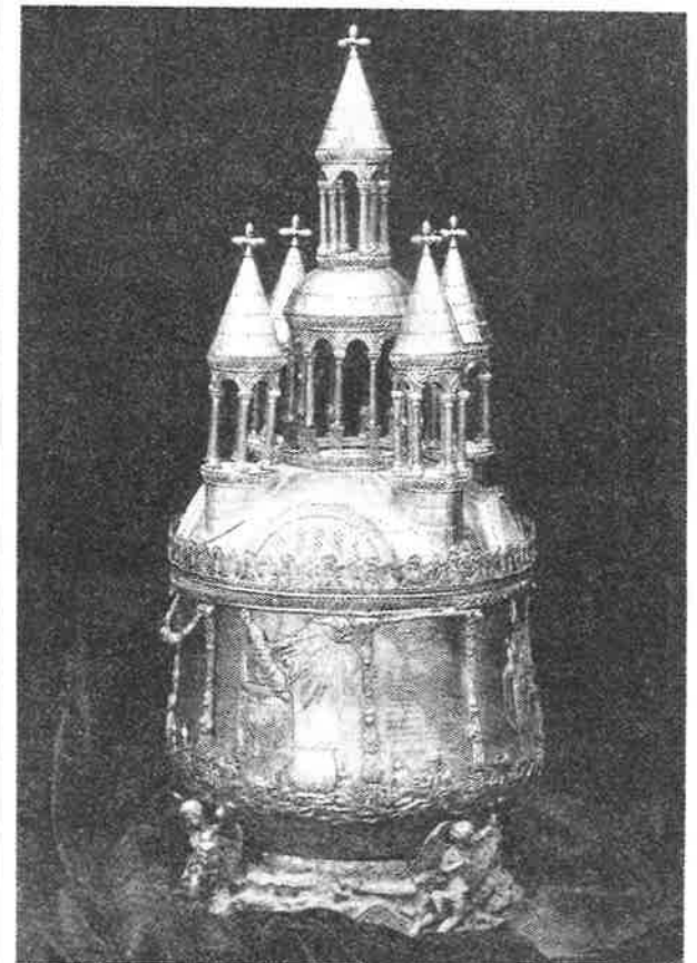
The Holy Muron Vessel

We have also printed a list of all the flowers, plants and oil used in preparing the Holy Muron.