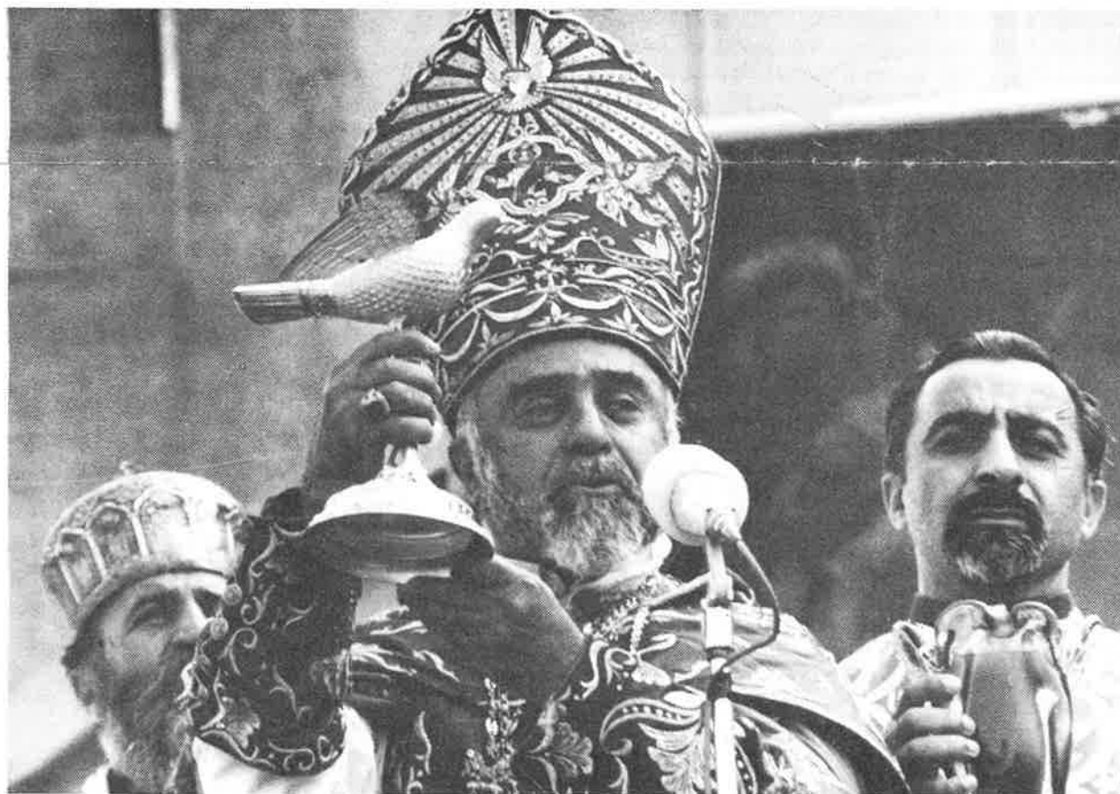
His Holiness Karekin II pours the Holy Muron from Etchmiadzin into the new Muron of the Catholicosate of Cilicia. The silver dove was a gift from His Holiness Vasken I