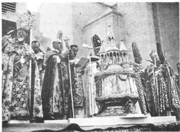
Twelve Archbishops and Bishops participate in the blessing of the Holy Muron

At the conclusion of the ceremony, Catholicos Karekin delivered an inspiring sermon first rendering thanks and glory to God for having enabled him and his bishops to bless the Holy Muron in these most trying conditions in Lebanon. He then commented on the text taken from the Ritual in which it was said: "O Christ, You are the true Muron, pure and unspotted, who is in us every day as a holy perfume". He said that the Church uses the physical materials, in this case the olive oil, mixed with 50 different aromatic species, to symbolize the gifts of the invisible Holy Spirit and the intelligible and spiritual truths and realities.