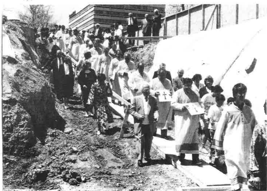
Members of the choir and faithful parishioners of the St. Asdvadzadzin Church in Toronto proceed to the location of their new church for the blessing of the church's foundation. Construction of the new edifice began last April and is expected to be completed at the end of December 1989. The architect, Mr. Roderick Robbie, has created a church using the features of Armenian architecture with the use of modern construction materials and techniques. (See artists rendering above). The community hopes to celebrate Christmas—January 6, 1990—in their new and magnificent house of worship.

Եկեղեցական արարողութեանց աւարտին բոլոր ներկաները հիւրասիրուեցան եկեղեցւոյ կանանց յանձնախումբին կողմէ: