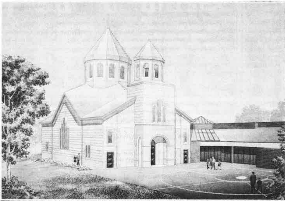
ԵԿԵՂԵՑԻՈՅ ՄՈՒՏՔՆ ՈՒ ԱՐԵՒՄՏԵԱՆ ՃԱԿԱՏԸ

Կիրակի, 21 Մայիս, 1989-ին Թորոնթոյի մէջ կատարուեցաւ Սբ. Աստուածածին Հայց. Առք. Եկեղեցւոյ Հիմերու զետեղումը: