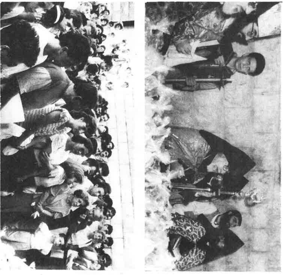
Blessing of Grapes in Btkfayaya: His Holiness Karekin II officiates at the Blessing of Grapes ceremony in Btkfaya, Lebanon, the Catholicos' summer residence and site of the Cilician See's seminary. In spite of the difficult situation in Lebanon the community has been flocking to the churches seeking comfort and strength.

Thus, a new era was being opened in the centuries-old history of the Catholicosate of Cilicia. After the traumatic and agonizing afflictions of the massacres, genocide, deportation and exile, new hopes began to dawn upon the Armenian church and nation.