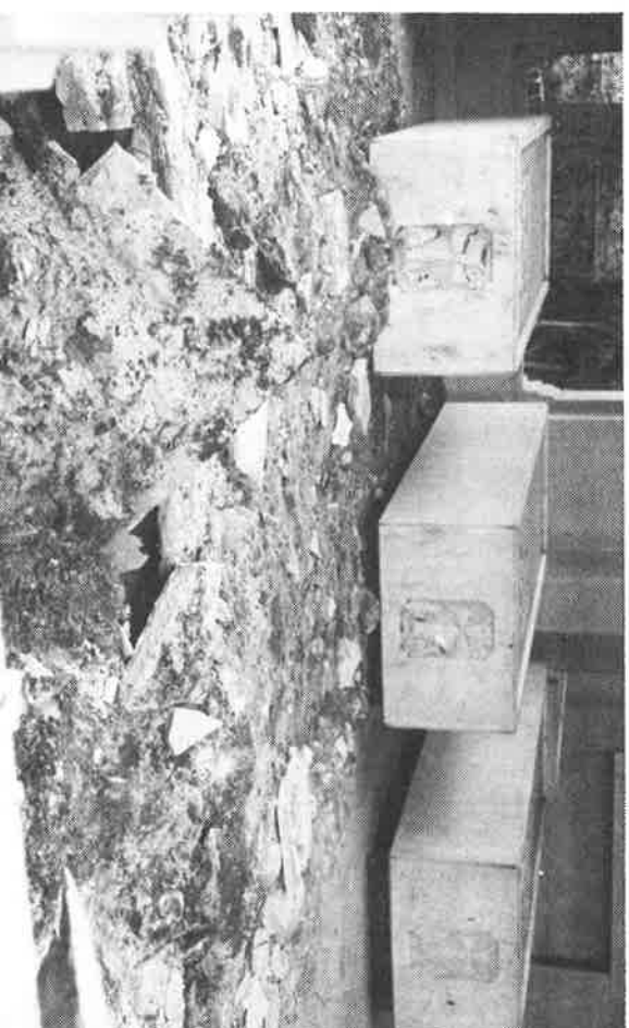
The Mausoleum near the tombs of Catholicoses Sahag, Papken and Zareh suffered extensive damage.