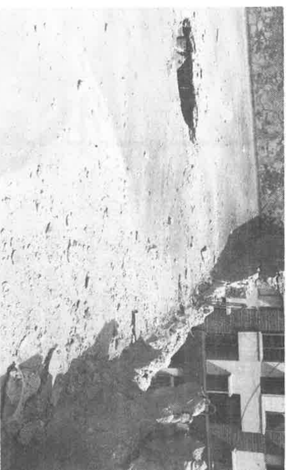
Shells hit the roof of the Library.

Fortunately, the indiscriminate shelling did not touch the Cilician See's Theological Seminary at Bikfaya where the Dean and his assistant priests and all 54 students live. All of them endured the resulting hardship caused by lack of electricity and the break-down of communications as well as other trying conditions. Although classes were obviously interrupted, the students did carry on with their readings and studies under the care and guidance of the staff.