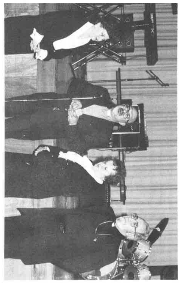
ՍՐ. ԱՏԹԵԱԿՈՍ ԱՐԳԱԹՆՆ ՎԱՐԺԱՐԱՆԻ ՌԻՇՅՈՐՈՐ ՏԱՐԾԱՆՆ ՊԱՐԱՀԱՆԻԷՍ

Please Don't Forget Your Annual Donation to OUTREACH. Send your tax-deductible donation to: Armenian Apostolic Church of America 138 East 39th Street New York, New York 10016 Indicate "For Outreach" on check. THANKS!