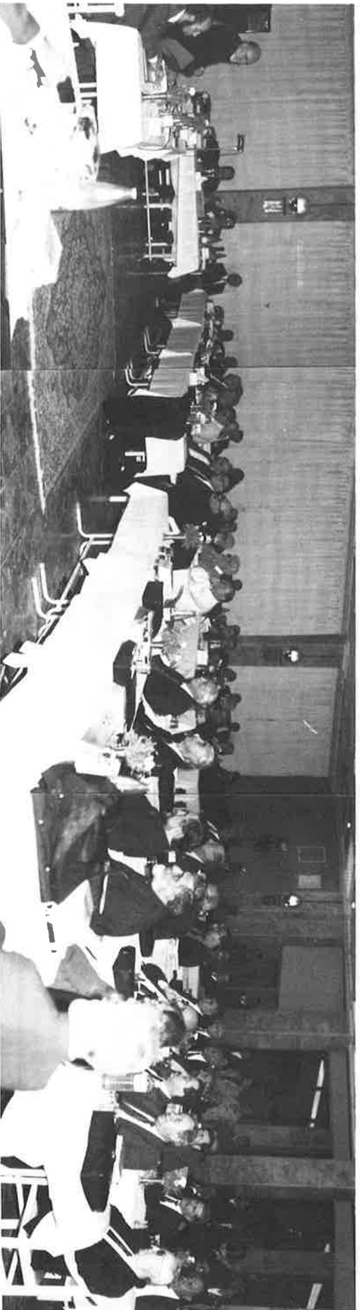
Կաթողիկոսութիւնը կրնայ իր դերակատարութիւնը բերել:

10. Կը թելարիէ որ Մէծի Տաճն Կիլիկիոյ Կաթողիկոսութիւնը Ամենայն Հայոց Հայրապետութեան հետ սիսային մշակել եւ կազմա-կերպել Հայց. Եկեղեցւոյ պաշտօնական քրիստոնէացման 1700-ամեակը»: