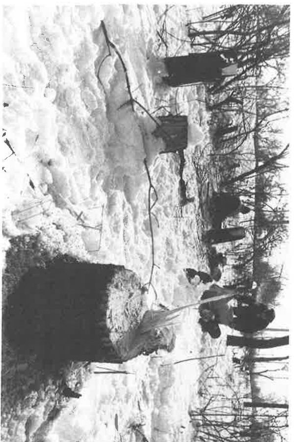
Plant a Tree in Armenia (see page 2)

With the cooperation of Armenia's Ministry of Agriculture and Forestry, the Eastern Prelacy of the Armenian Apostolic Church of America, plans to plant 200,000 trees in the Nork area of Yerevan. Thankfully, spring is here and the beleaguered people of Armenia will begin to have some respite from the inhuman suffering it experienced due to the blockade imposed by Azerbaijan. But, with the coming of Spring comes additional problems. The lush trees of Armenia—the people's only defense against the bitter cold—are gone. Throughout the country trees have been cut to the point where they will never bloom again. It has been estimated that more than a million trees, 50,000 in Yerevan alone, were cut this winter. For Armenia, this could be a Silent Spring .