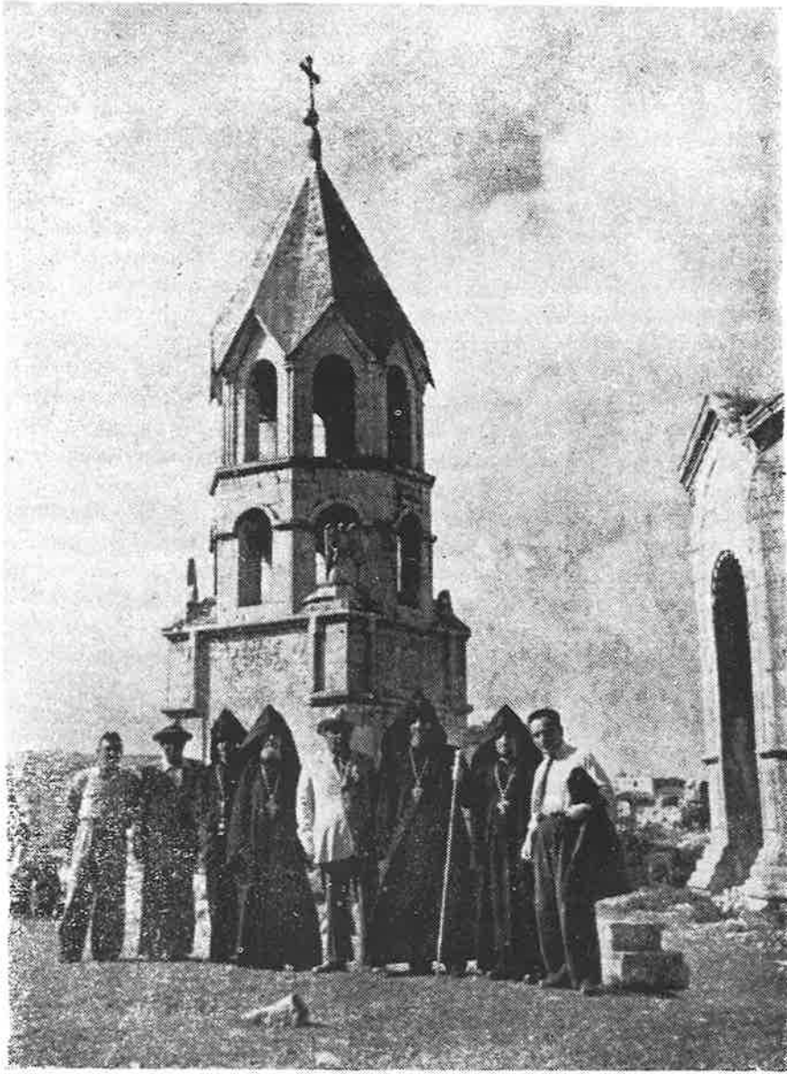
Վազգէն Ա. Կաթողիկոսը Շուշիի Ա. Գրիգոր Լուսաւորիչ Եկեղեցու շէնքակաւտան առջեւ, 1957-ին:

Հոյակապ է: Հայ ազգը ինքնիրեն վերագտնում է ամէն տեղ: Ես կարծում եմ, քիչ անգամ կարելի է հանդիպիլ այսպիսի պատկերի: Ե՛ւ մեր կեանքում հայկական, ե՛ւ ընդհանրապէս այլ ժողովուրդների կեանքում: Իրապէս, կարծէք ինչ-որ երկնային մի լոյս, մի ուժ, Սուրբ Հոգու ուժը իջել է այս ժողովրդի վրայ եւ