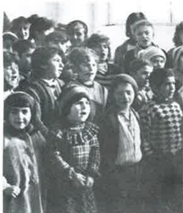
AID TO ORPHANAGES...