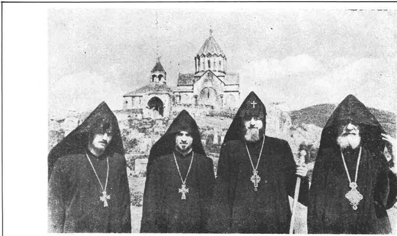
Վազգէն Ա. Գանձասարի Պատմական վանքին առջեւ, 1957-ին:

վրայ: Բայց վերջին հարուածը նրան էլ է հասնում եւ ինչ-որ մեղադրանքի տակ նրան Բաքում բանտարկում են: Նա մնում է բանտում աւելի քան մէկ տարի առանց դատավարութեան: Փաստօրէն նա ոչ մի մեղք չուներ անշուշտ: Այդ շրջանում արդէն լրիւ փակուում են բոլոր վանքերն ու եկեղեցիները: Վերջում, դիմումների, խնդրանքների միջոցով, վերջապէս Բաքում բարեհաճում են դատը տեսնել եւ ազատ արձակել Վրթանէս Եպիսկոպոսին, պայմանով, սակայն, որ նա այլեւս Գանձասար չվերադառնայ եւ մեկնի ուղղակի էջմիածին: Այսպիսով իջնում է ողբերգական վարագոյրը Ղարաքաղի եկեղեցական հայ կեանքի առջեւ: