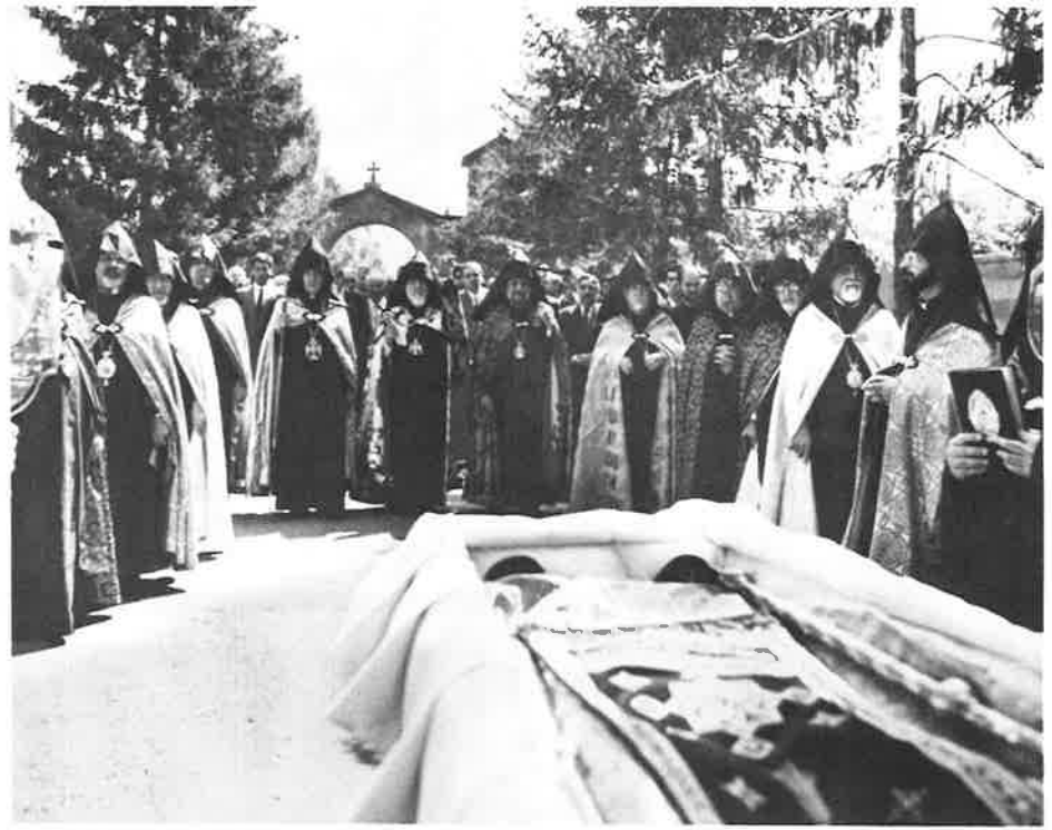
Bishops of the Armenian Church from all over the world gather to honor His Holiness Vazken I as he is taken to his burial site. Leading the entourage are His Holiness Karekin II, His Beatitude Archbishop Torkom Manoogian, and His Beatitude Archbishop Karekin Kazanjian.

Under his aegis, the Armenian Bible—originally translated into Classical Armenian in the 4th century—was translated into modern Armenian (both the Eastern and Western dialects). And under his direction, Etchmiadzin , the official monthly journal of the Catholicate—