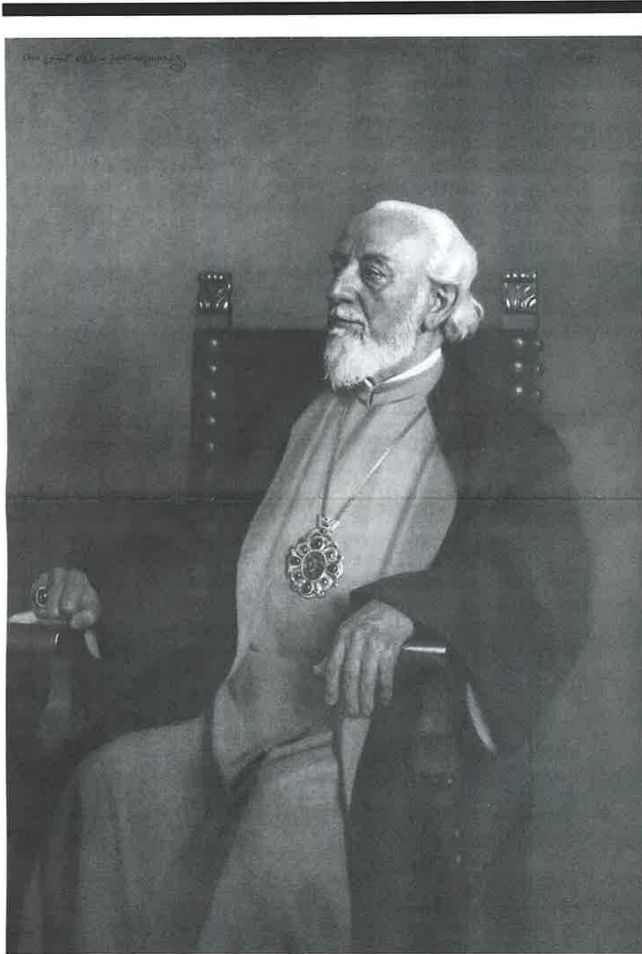
Vazken I Catholicos of All Armenians 1908-1994

Խոր վշտով կը հաղորդենք Ամերիկայի Արեւելեան Ծրջանի եւ Գանատայի մեր թեմի հաւատացեալ ժողովուրդին, Ամենայն Հայոց Վեհափառ Հայրապետին՝ Տ. Տ. Վազգէն Ա. Կաթողիկոսի վախճանումը, որ պատահեցաւ Հինգշաբթի 18 Օգոստոս, 1994-ի առաւօտեան ժամը 7:15-ին, Երեւանի իր հայրապետական առանձնատան մէջ: Մայր Աթոռ Ա. Էջմիածնի դիւանէն ստացուած հեռագիր մը կը հաղորդէ հետեւեալը—