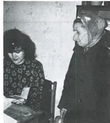
AID TO ELDERLY...