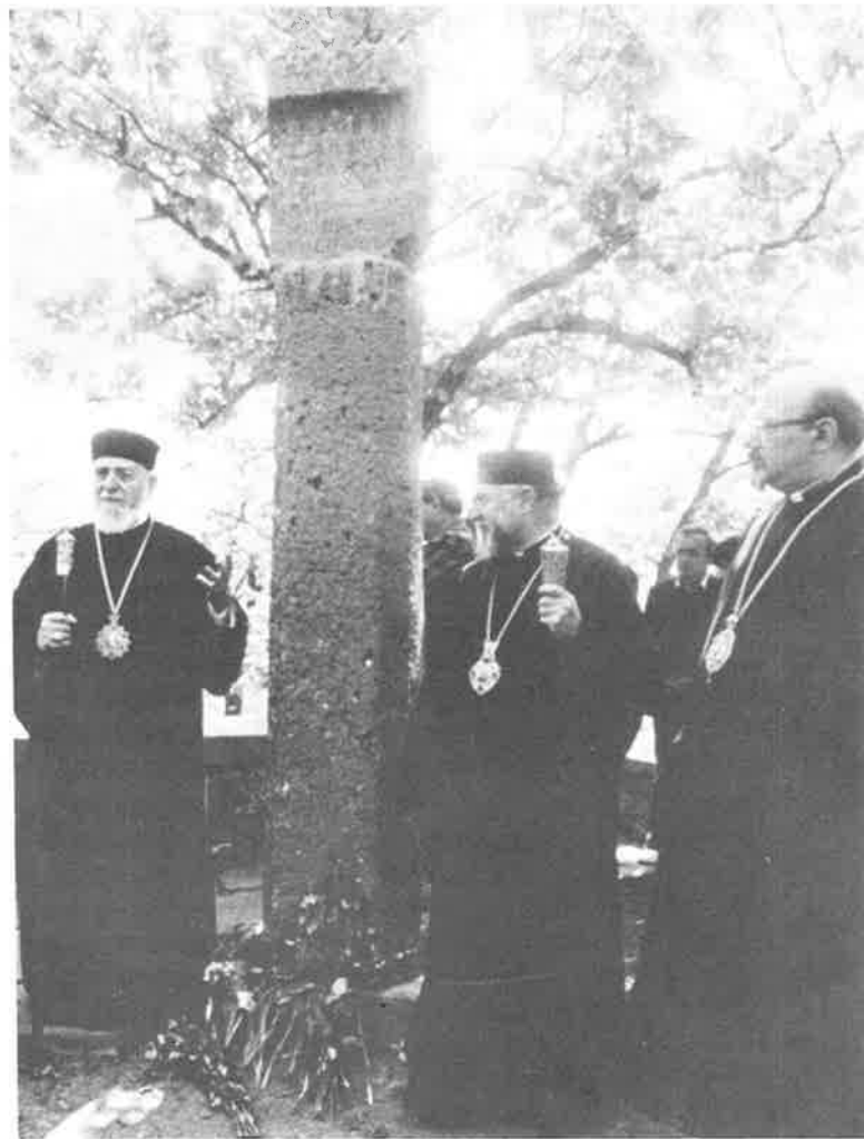
H.H. Vazken I with Karekin Vehapar and Archbishop Mesrob Ashjian at memorial to Khrimian Hayrig during visit to Datev, April 1989.

10. Ինչպէս այլ առիթներով արտայայտուել ենք, մեր օրերին Հայաստանի Հանրապետութեան պայմաններում, այլ եւս որեւէ այժմէութիւն չունեն հայ սփիւռքում, սովետական կարգերի շրջանում ստեղծուած կացութիւններն ու գործելակերպերը, ի մասնաւորի հայ եկեղեցական կեանքի մակարդակի վրայ եւ Մայր Աթոռիս ու Տաճն Կիլիկիոյ Աթոռի յարաբերութիւններում: Պարզ է բոլորիս, որ այդ կացութիւններն ու գործե-