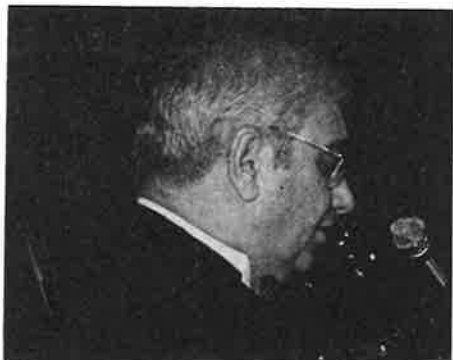
Chuck Haytaian, speaker of New Jersey Assembly, reads proclamation in recognition of Guild's 20th anniversary.