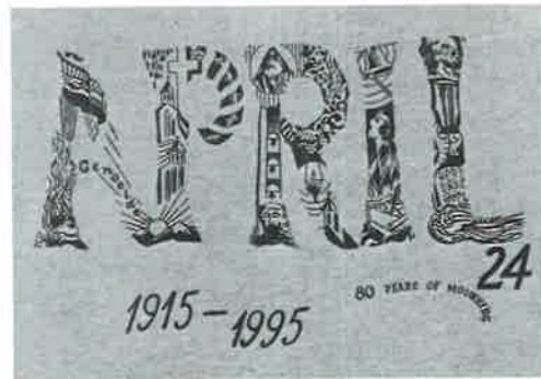
This is the print that appears on the shirts.

The year 1995 marks the 80th Anniversary of the Armenian Genocide. The Genocide will remain in the heart of every Armenian as the most tragic event in the Armenian history and will be expressed in various ways until justice is done. Therefore, the Armenian Prelacy Bookstore has printed T-shirts and sweatshirts dedicated to the 80th anniversary of the Genocide.