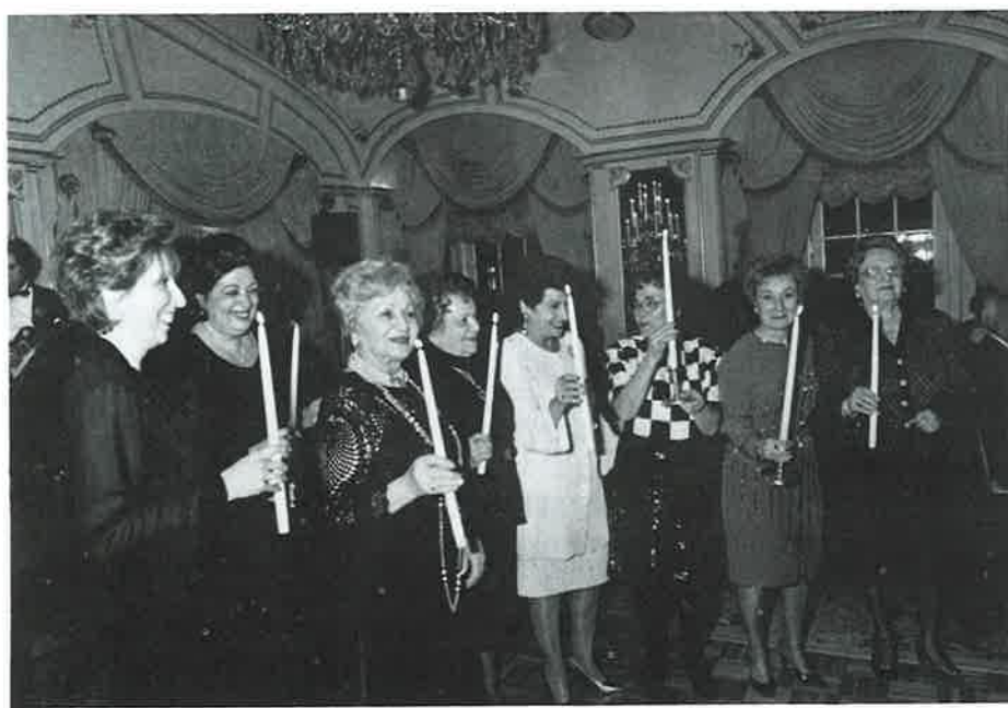
Members of the Prelacy Ladies Guild participate in the candle lighting ceremony.

The auspicious occasion marking the 20th anniversary of the Prelacy Ladies Guild and the Feast of Light was celebrated in February in grand style at the St. Regis Hotel in New York City in the presence of guests from as far as Australia, Washington, D.C.,