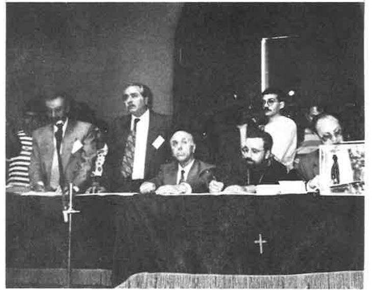
A scene from the elections.