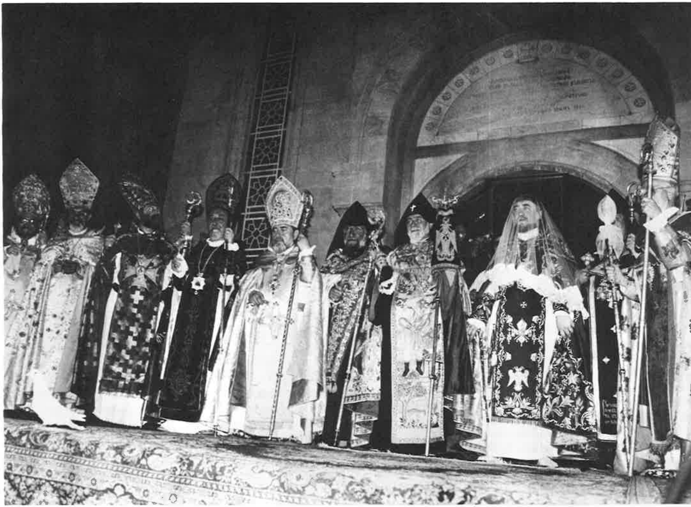
The hierarchy of the Armenian Church with the newly consecrated Catholicos of the Great House of Cilicia.