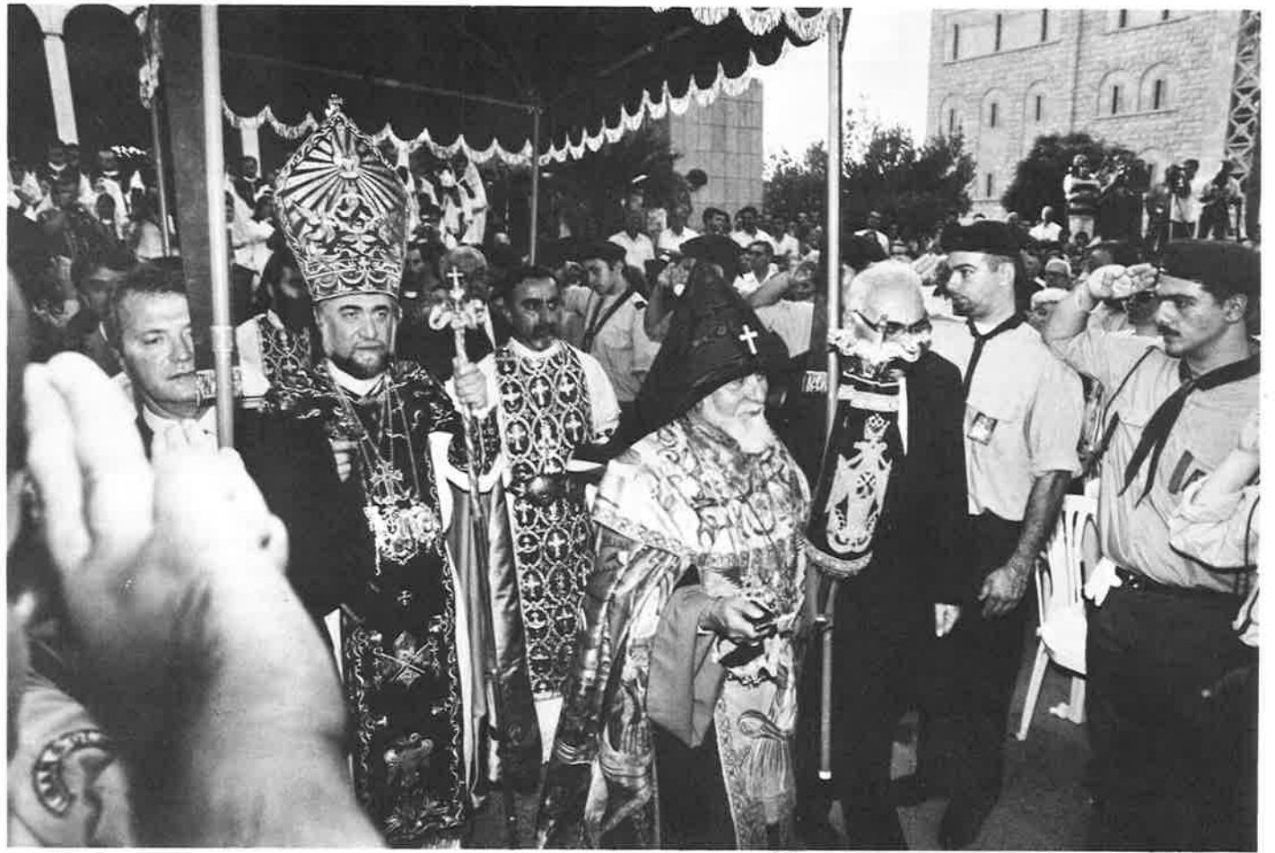
His Holiness Karekin I, Supreme Patriarch of All Armenians leads Aram I to the Cathedral.

"This spiritual home is everyone's home," he said. "Its doors are open wide for everyone. It will serve everyone and will work with a vision of one church, one people, and one homeland. This is how I was taught under Zareh I, Khoren I, and Karekin II. And this is how we will teach