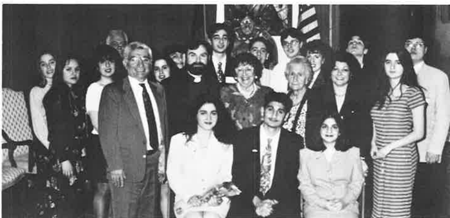
The graduates surrounded by teachers and administrators.