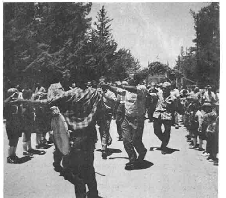
Delegates and guests enjoyed a traditional Armenian welcome in the village of Anjar.