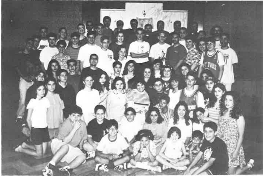
Staff and students at the 9th annual Summer Religious Program sponsored by the St. Gregory of Datev Institute.

Fifty-eight young adults and teens from 11 Prelacy parishes and seven staff members came together for the Ninth Annual Summer Religious Studies Program of St. Gregory of Datev Institute, which took place at the St. Mary of Providence Center in Elverson, Pennsylvania, July 2-9, 1995.