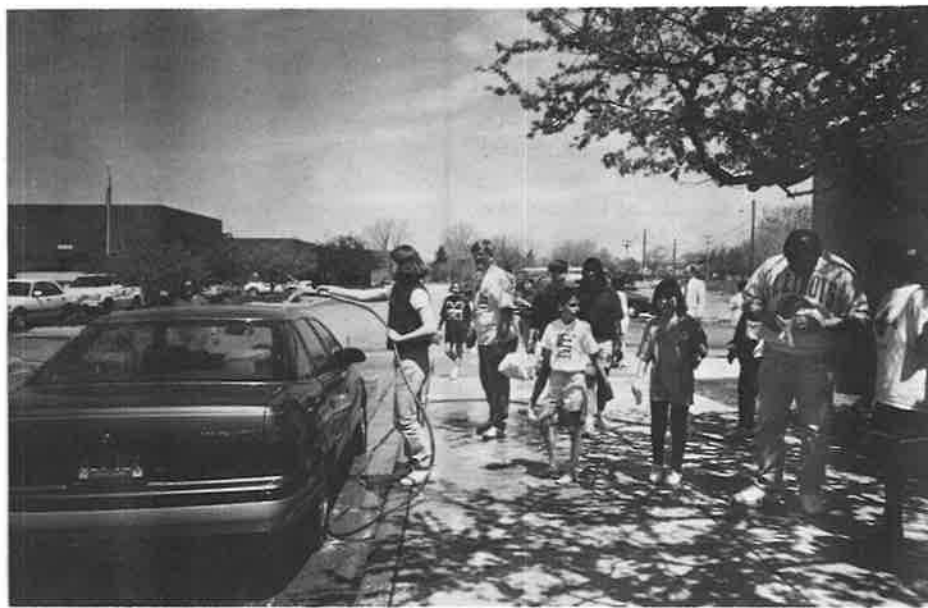
Sunday School students of St. Sarkis Church, Dearborn, Michigan, initiated a car-wash fundraiser. Proceeds were donated to the Prelacy to be used toward projects in Artsakh.