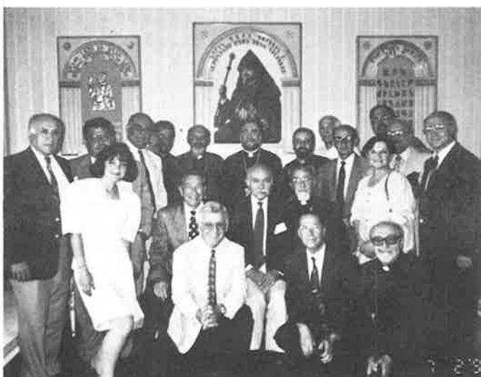
Catholicos Aram I with delegates from Eastern Prelacy.