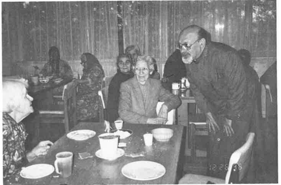
Archbishop Ashjian visits with residents of an old-age home in the Bengladesh area of Yerevan. The Prelacy's successful thanksgiving appeal provided supplemental income for more than 2,000 retirees who live alone, as well as gifts for residents of the old-age home seen above.

ե. ՀՕՄ-ի Հայաստանի 40 մասնագիտորէն տրամադրուեցաւ 440.000