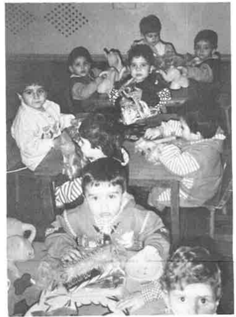
Food and toys are distributed to the children in the Nork orphanage thanks to the generous response to the Thanksgiving appeal which the Prelacy issued.

Փոքրիկ ճիւղ մըն էր 1996-ի Գոհարանութեան Օրուան առթիւ եղած այս նախաձեռնութիւնը: Վստահ ենք, որ թոյր անոնք որոնք մասնակցեցան այս արշարժին, ուրախութեամբ պիտի կարդան այս տողերը եւ գիտնան որ իրենց փոքրիկ նուէրով ուրախացուցին 2100 ծերունիներ, 187 ծերանոցի բնակիչներ, 73 վեթեաքներ, 55 որբուկներ, 95 մանկապարտէզի երեխաներ եւ քազմաթիւ ուրիշներ: Անոնք թոյրն ալ այս կաղանդը