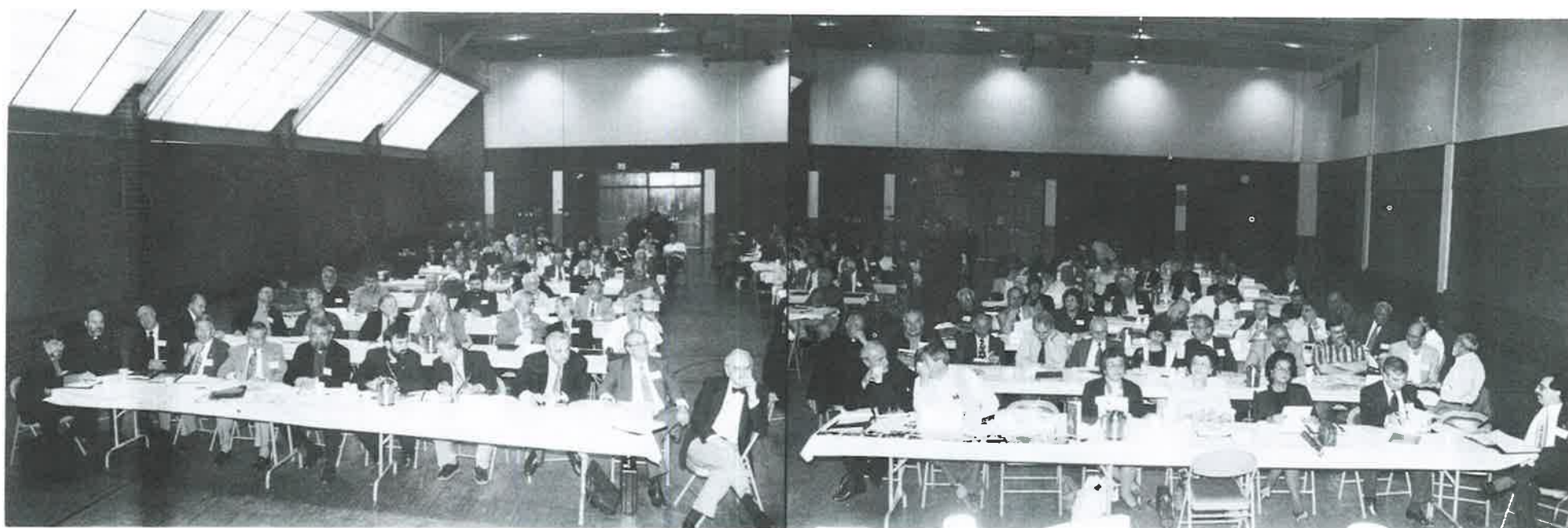
A panoramic view of the National Representative Assembly in Watertown, Massachusetts. Coverage of the NRA begins on page five.