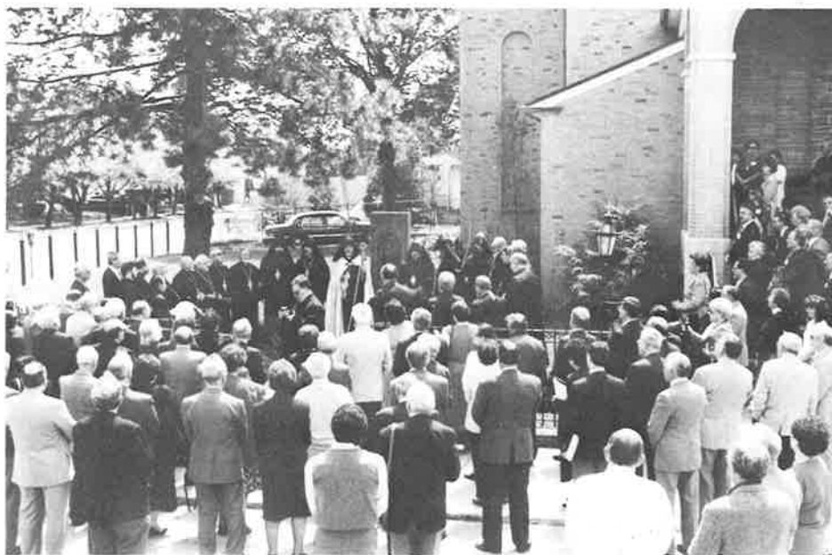
Clergy and delegates in front of the khatchkar monument next to St. Stephen's Church participate in a requiem service in honor of the martyrs of the Armenian Genocide.