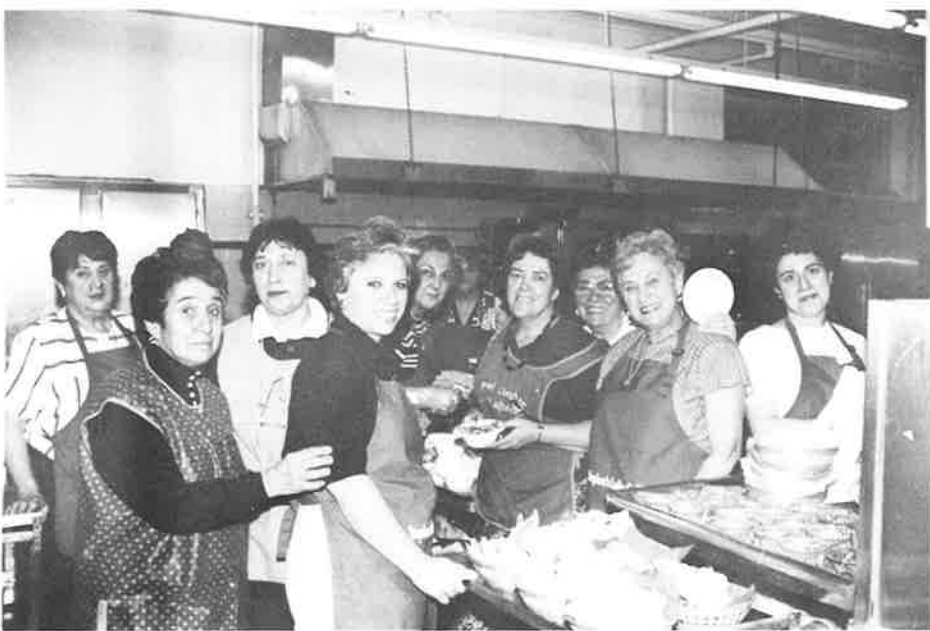
Members of the St. Stephen's Ladies Guild worked round the dock preparing and serving breakfast, lunch, dinner, and coffee breaks during the duration of the Assembly.