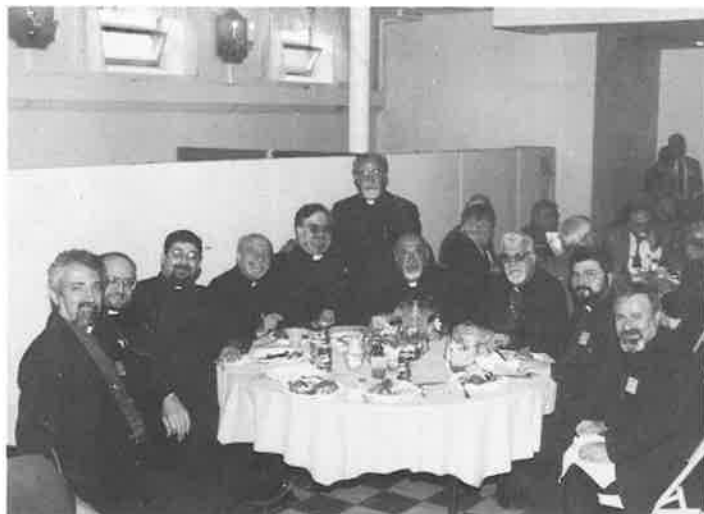
Brothers-in-Christ break bread together.