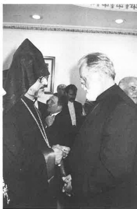
With representatives of St. Sarkis Church in Douglaston.