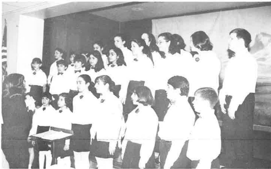
Armenian Children's Chorus of Boston provide entertainment for the delegates.