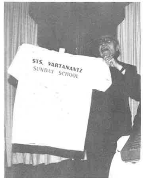
Der Mesrob receives an "autographed" shirt from the Sunday School students.