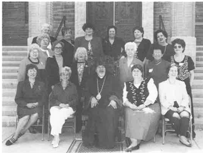
Archbishop Ashjian with the National Association of Ladies Guilds whose annual meeting coincides with the National Representative Assembly.