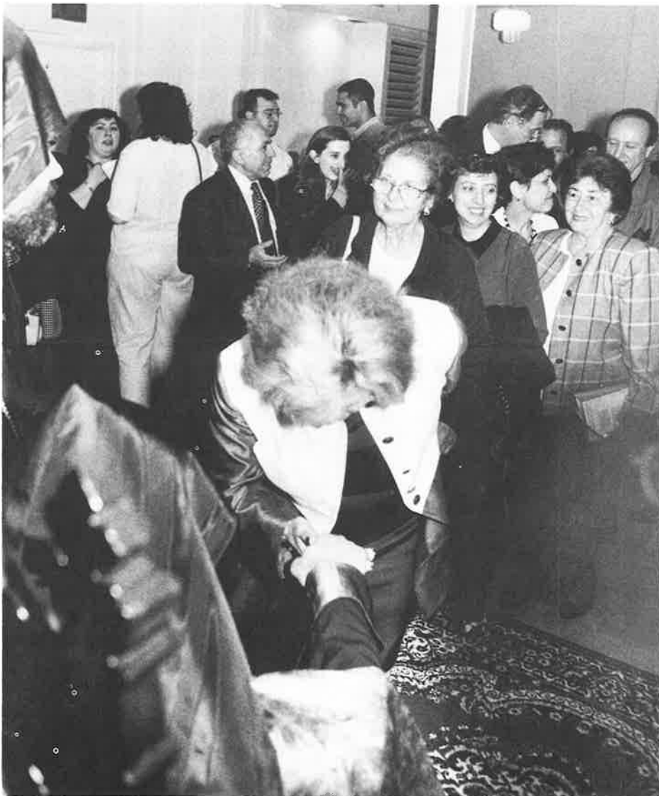
Atchahampoyr at St. Illuminator's Cathedral Hall following Hrashapar Services.