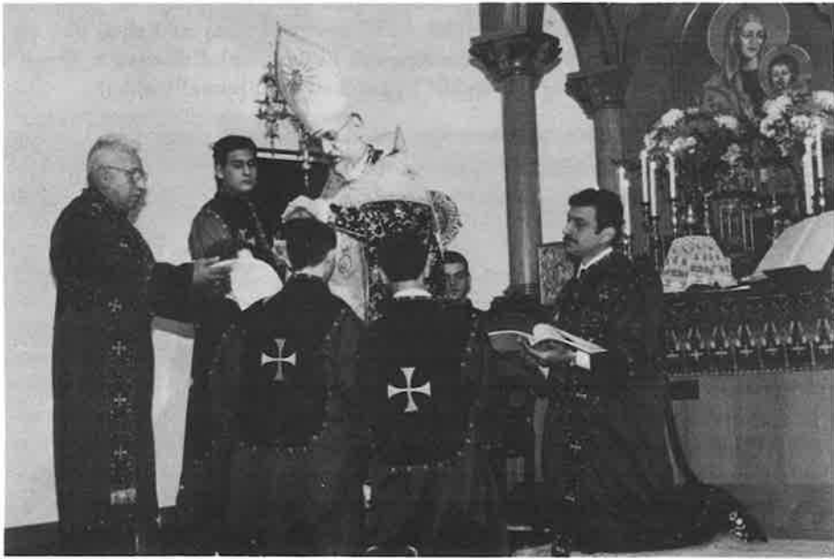
Ordination of acolytes at St. Sarkis Church

Before a young man enters the major Holy Order in the Armenian Church, he must receive four minor ranks. One who receives these four minor ranks becomes Tbir (clerk or chorister). The Tbir is conferred special privileges which become the foundation of his service to the church as a participant during worship services. There are four distinct functions of a Tbir. The four orders of minor ranks are: 1) Doorkeeper (Tmaban), 2) reader (Untertsogh), 3) Exorcist (Yertrmetsootsich) and 4) Candle lighter/bearer (Chahengal).