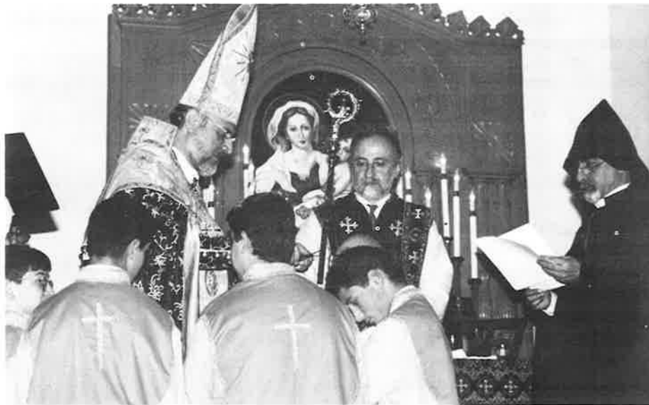
Ordination of acolytes at St. Gregory Church