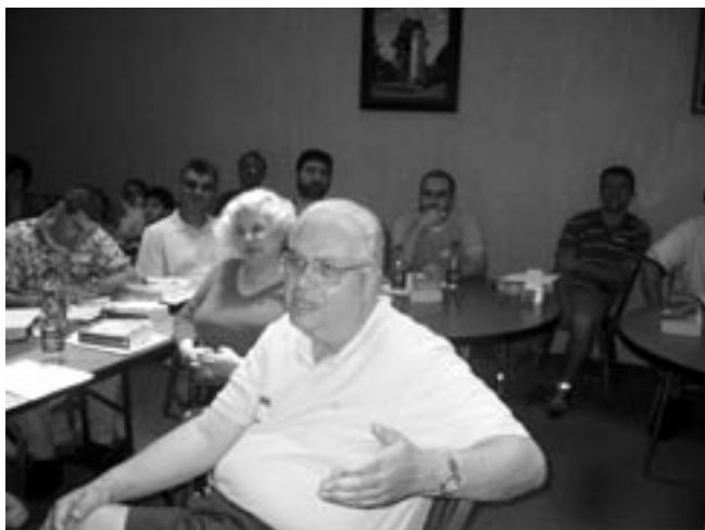
The seminar elicited questions and comments from the participants.

to us through the sacraments, the role and the place of ascetical effort, the link between ethical living and deification. “We have to be conformed to Christ, we have to be embossed by Him. Our minds must be remade and our whole nature must be transformed, and this begins with baptism,” he said.