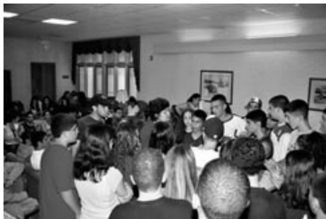
Listening to the rules for the Jeopardy game.

"There is something about evening service that is so moving. It offers a chance to reflect, a time to meditate. Every day, as night sets in, I look forward to this special time to communicate with God. I remember loved ones I have lost, pray for my family and friends, or simply think about my day. Sometimes I don't even focus on one particular thing; my mind darts back and forth until I am completely immersed in thought. Sometimes I am moved to tears, others I find myself lost in the music. The gentle rise and fall of the notes, the beauty of the words, the spiritual connection – I never want it to end. Yet when it does, I leave the chapel and prepare for bed, humming all the while. And a gentle smile creeps across my face as I drift into a blissful sleep."