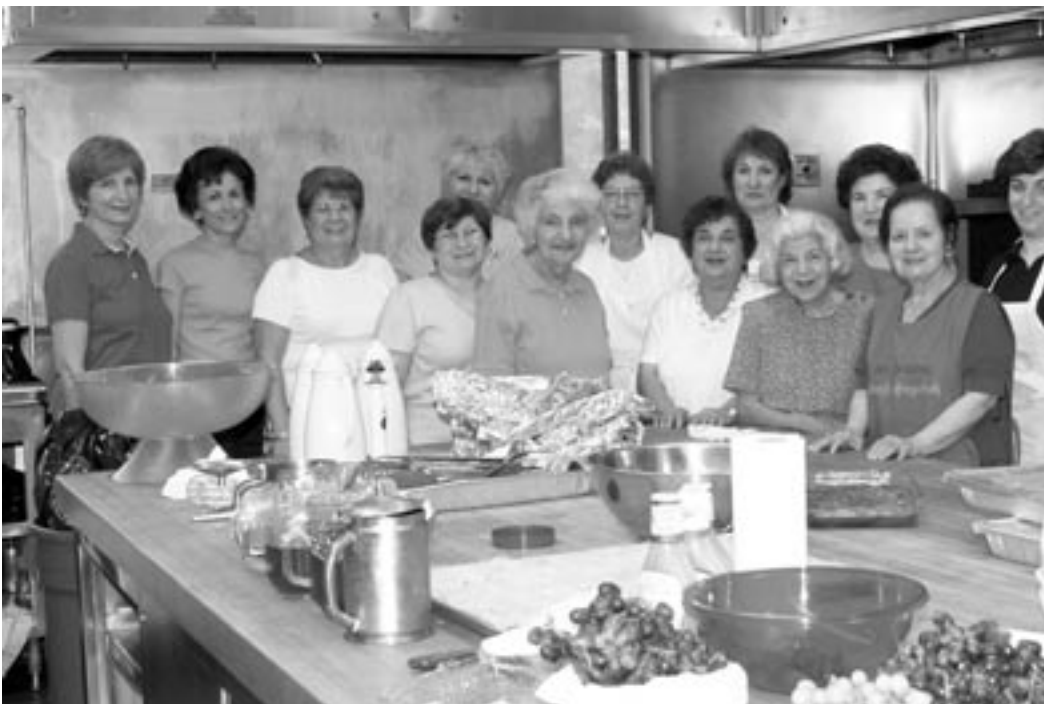
Some of the members of the Philadelphia Ladies' Guild who prepared meals for the delegates and guests.

The 2004 NRA officially ended with the benediction and the singing of Giligia. ✕