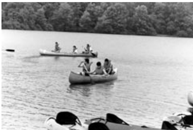
Summertime fun is combined with learning.