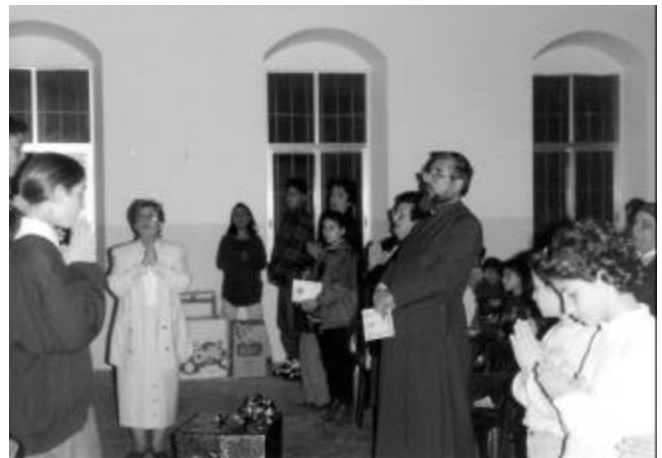
Archbishop Zareh with students during the time he was the Prelate of Cyprus.

Որպէս գինի մխիթարութեան՝ կը հասնէր բոլոր տառապեալներուն, վշտահարներուն ու սգաւորներուն: