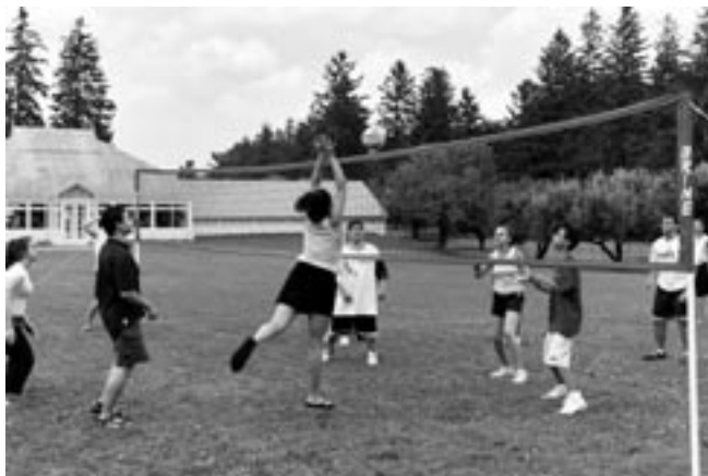
Enjoying a game of volleyball.

"Datev was a great experience. I had A LOT of fun, but it isn't just fun and games because you have to go to classes and chapel. You play a lot of sports including the first ever DATEV GAMES. You also go swimming, play volleyball, soccer, etc. I would really recommend going to Datev."