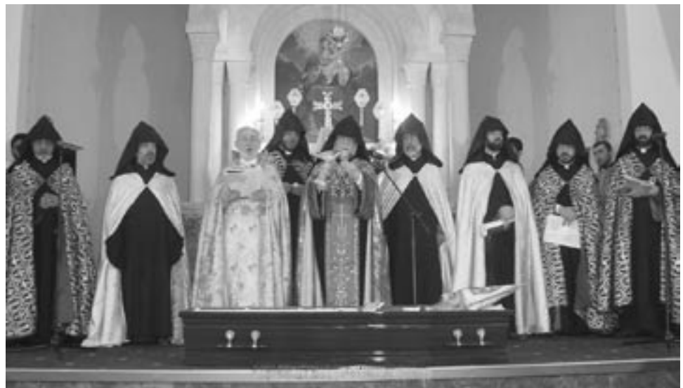
His Holiness pours the Holy Chrism.