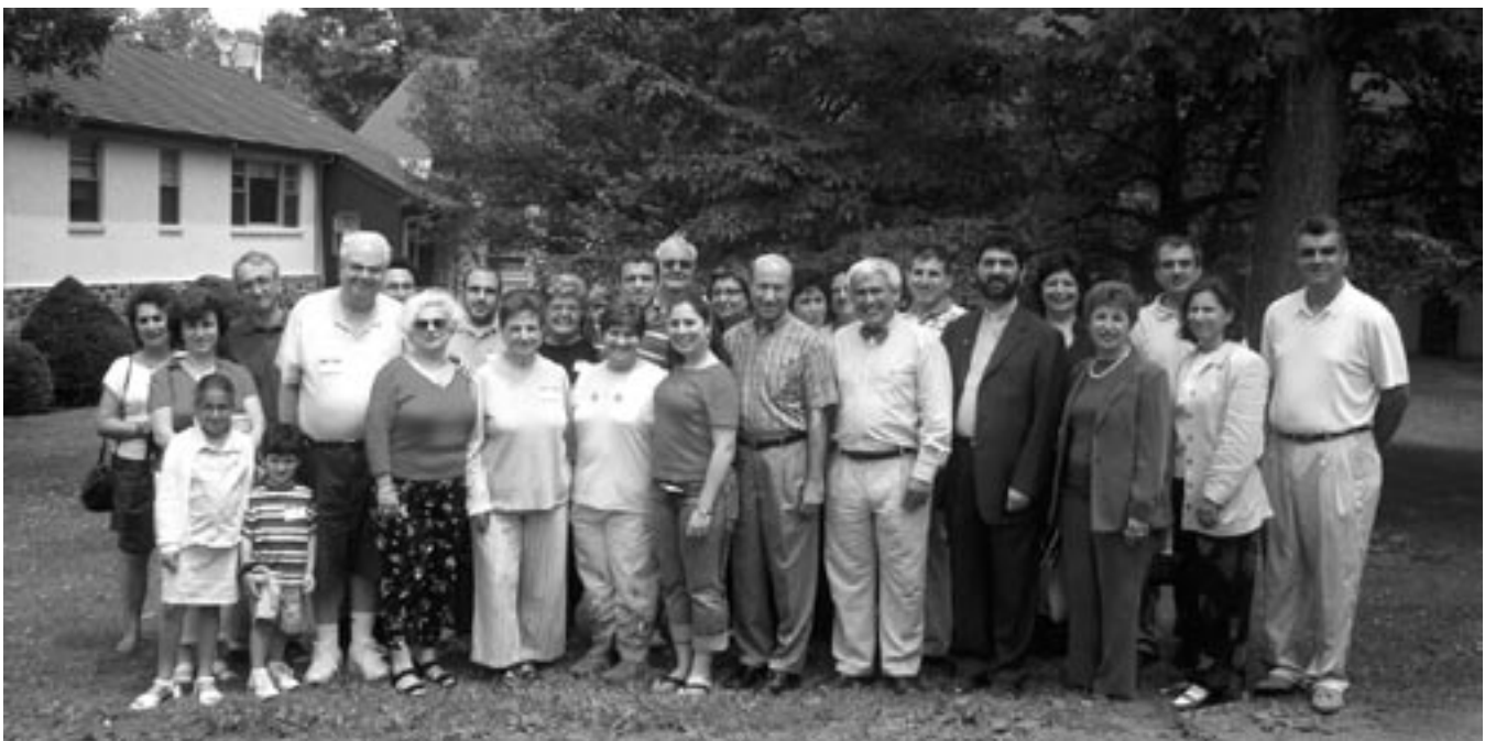
Seminar participants and leaders.

He went on to discuss the Beatitudes as “the constitution of the Kingdom,” the graces of God communicated