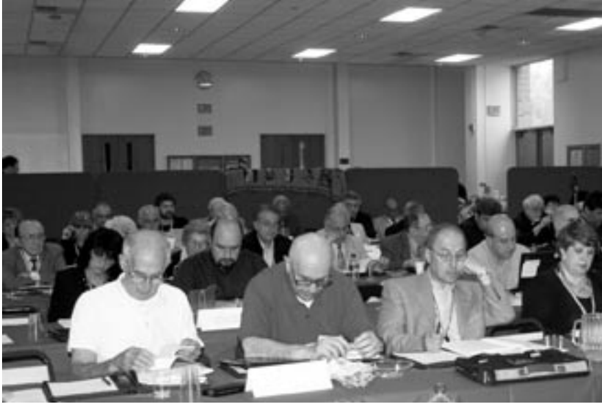
A scene from the Assembly.

issued, one religious and the other civil. The importance and deeply symbolic difference, however, is that the church will no longer assume responsibility for consecration of the civil contract. By this change, the church lodges its profound disagreement with the state's unilaterally reached and theologically mistaken redefinition of marriage.... Our sacramental vision of marriage is profoundly emblematic of how we understand ourselves as church in relation to Christ and even our understanding of God as Trinity.”