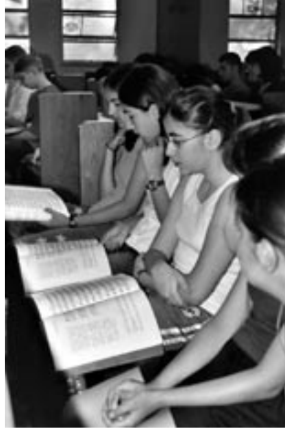
A scene from sunrise service - Arenakal