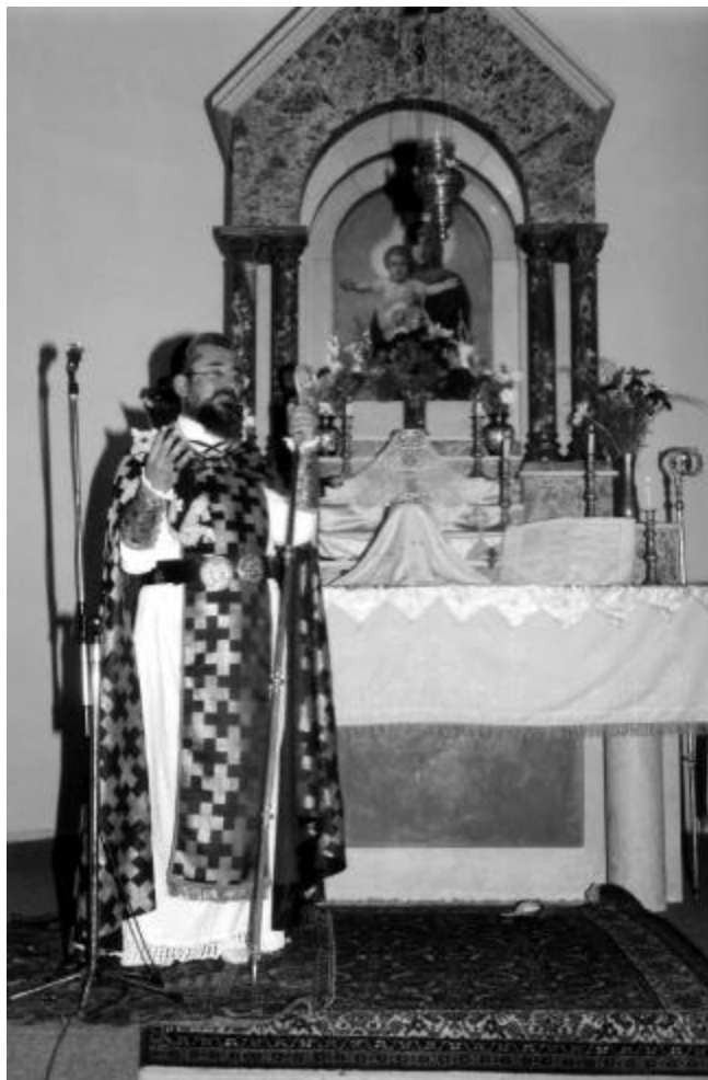
Archbishop Zareh delivers a sermon in the chapel dedicated to the Holy Virgin in Bikfaya, Lebanon.

Հոգելո՛յս Սրբազան Հայր, աչքերուս եւ մտքիս մէջ թարմ է տակաւին Մայիս 1966 թուականը, Հոգեգալստեան Տօնին Ս. Պատարագի ընթացքին Ս. Խորանին առջեւ ծնկադիր, յատուկ աղօթքներու ընթերցումով եւ շարականներու երգեցողութեամբ, հարիւրաւոր հաւատացեալներուն առջեւ եւ անոնց վկայութեամբ ձեռնադրիչ Գարեգին Սրբազան, ապա Մեծի Տանն Կիլիկիոյ Գարեգին Բ. եւ հետագային՝ Ամենայն Հայոց Գարեգին Ա. Կաթողիկոս