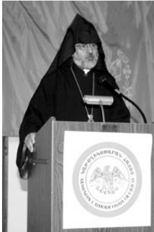
Archbishop Oshagan Chobloyan giving his message at the 2004 National Representative Assembly.

our nation's forced deportation from its ancestral lands of thousands of years, until becoming a Diaspora and the establishment of relationships with various other people, the Armenian Church was basically only for Armenians—those born with Armenian genes and blood. Today belonging to the Armenian Church is in different circumstances with changing understandings. Through inter-marriage the so-called pureblooded Armenian becomes a different person. But, this is not a reason for the "odar" and those born from inter-marriages to not become members of the Armenian Church. As long as the