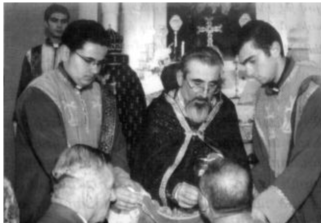
Archbishop Zareh gives Communion to the faithful at the Cathedral in Antelias.

կոչումին մէջ Եսայիի մարգարէութեան արձագանգը կը թողու իր ետին՝ իր առողջութեան եւ մանաւանդ անհանգստութեան օրերուն. «անիկա անիրաւութիւն կրեց ու չարչարուեցաւ, բայց իր բերանը չբացաւ: Մորթուելու տարուող ոչխարի պէս, իր խուզողներուն առջեւ մունջ կեցող մաքիի պէս՝ այնպէս բերանը չբացաւ» (Ես 53.7):