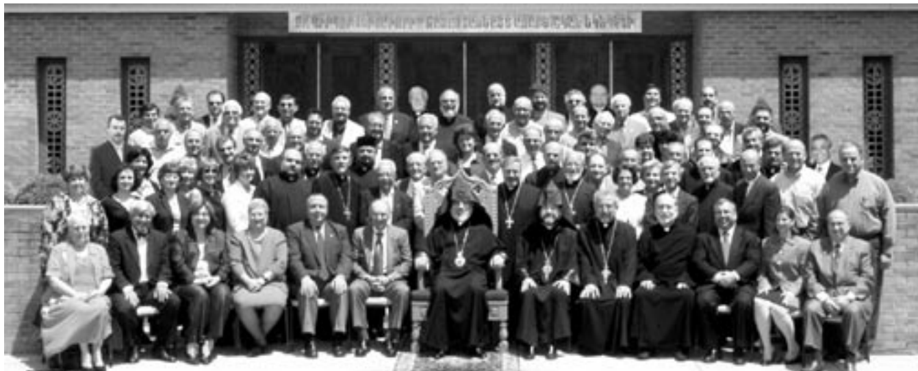
Delegates to the 2004 National Representative Assembly surround Archbishop Oshagan in front of Philadelphia's St. Gregory Church.

The National Representative Assembly (NRA) of the Armenian Apostolic Church of America (Eastern United States) met in Philadelphia from May 19 to 21, at which time clergy and lay delegates deliberated on future programs of the Armenian Church in America. The host parish was St. Gregory the Illuminator Church.