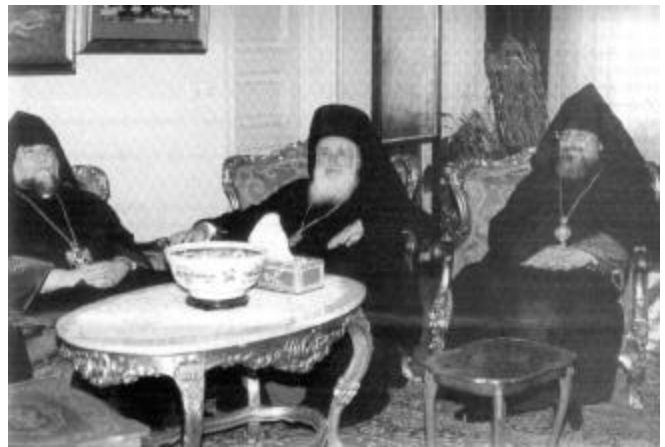
Archbishop Zareh with His Holiness Aram I and the Archbishop of Cyprus, Christosthomos.

մէջ ապրելով ու իր կեանքը աղօթքով շողախելով: Տիպար հոգեւորական եղաւ Զարեհ Սրբազան՝ իր առաքելութեան ճամբան հունաւորելով այնպիսի արժէքներով ու արժանիքներով, որոնք որակային տարբերութիւն մը կը յառաջացնեն հոգեւորականի եւ աշխարհականի միջեւ: Տիպար հոգեւորական եղաւ Զարեհ Սրբազան՝ իր անմիջական շրջապատը աւետարանական ճշմարտութիւններով ու բարոյական սկզբունքներով ծաղկեցնելով: