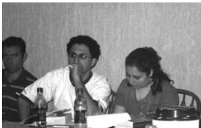
The speakers successfully engaged the participants to think about the issues.