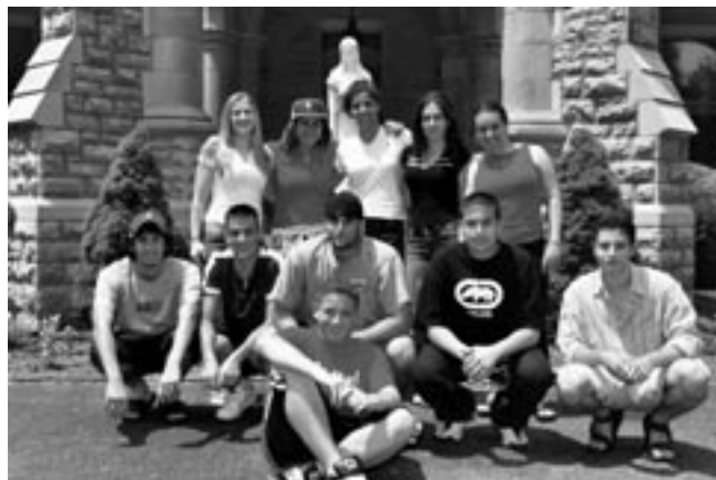
The 2004 graduating class.