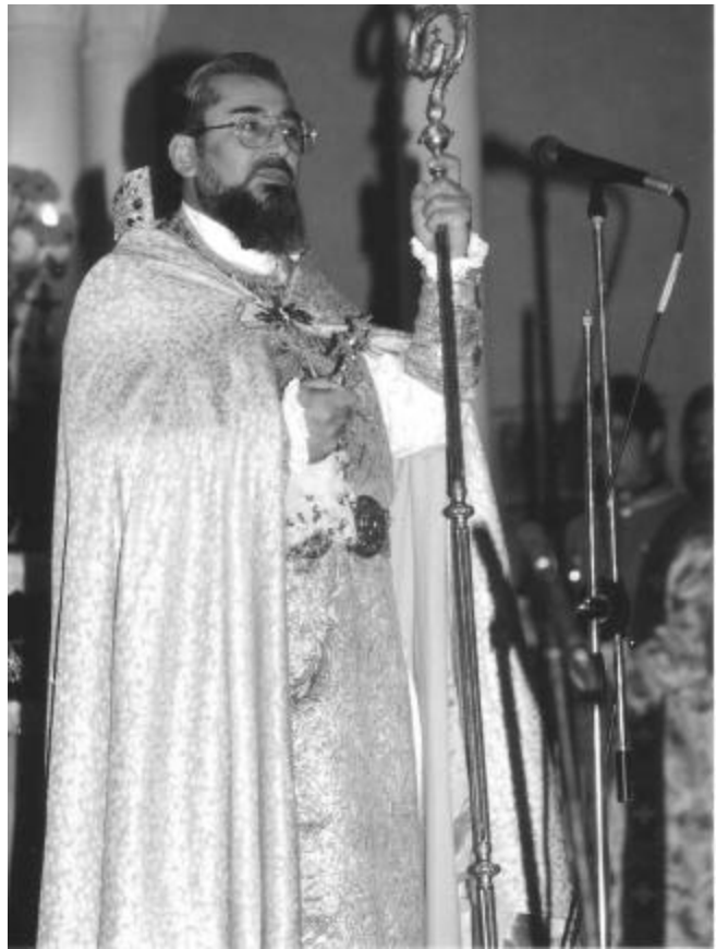
Archbishop Zareh delivering a sermon.

Կը մտածեմ թէ բաժանումը որքան առանձին ձգեց զիս: Աւելի ճիշդ՝ կէս ձգեց զիս: Մտածումներս երբ ժխտական պոռթկումի արտայայտութեամբ ու բողոքով կը սկսին սղոցել ուղեղս, յանկարծ կանգ կ'առնեմ եւ Աստուծոյ գոհութիւն կու տամ, որ այս աշխարհէն իր բաժանումէն առաջ հոգեւոյս Չարեհ Սրբազանը կեանքին վերջին չորս ամիսները ինձի