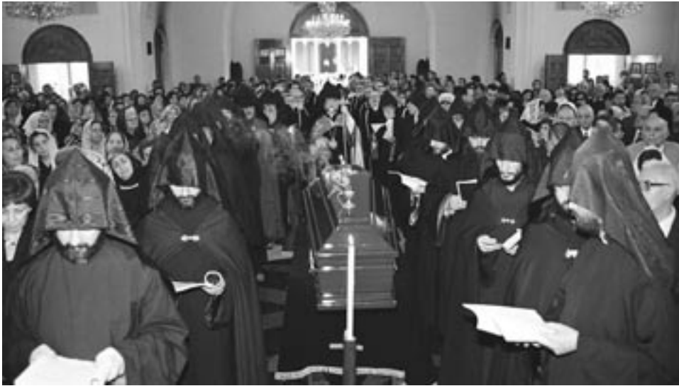
His Holiness Aram I, members of the Cilian Brotherhood, and mourners during funeral services in the Cathedral of St. Gregory the Illuminator in Antelias, Lebanon.