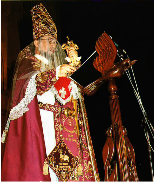
The newly consecrated Catholicos Aram delivers his first sermon.

For decades His Holiness has lectured regularly on armenological, theological, and ecumenical subjects at the Cilician Seminary and Haigazian University in Beirut. He has also given numerous public lectures in various universities, academic and cultural centers, and at public events and international gatherings. He considers lecturing to and engaging in dialogues with students to be one of his most rewarding tasks.