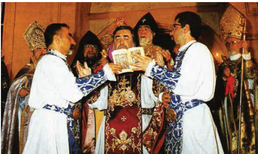
His Holiness Karekin I, Supreme Patriarch and Catholicos of All Armenians, anoints the newly elected Catholicos of the Holy of Cilicia, July 1, 1995

The Consecration of the new Catholicos took place during the Mass celebrated by Catholicos Karekin with the Patriarchs of Jerusalem and Constanti-