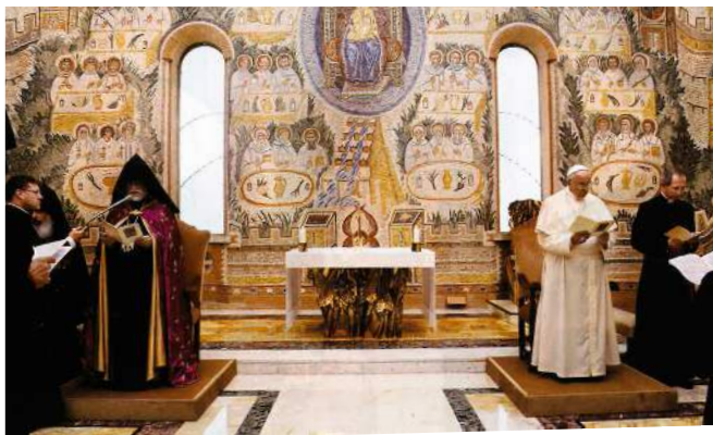
His Holiness Catholicos Aram with His Holiness Pope Francis at the Vatican.

global fellowship of churches, which comprises more than 350 churches from different confessions, cultures, nations and regions. He became the first Orthodox and the youngest person to be elected to the position of Moderator. After serving as Moderator for seven years, His Holiness was unanimously re-elected at the Harare Assembly in 1998. The re-election of His Holiness, which was based on his “strong leadership, firm commitment, theological knowledge, and administrative experience,” was unprecedented in the history of the WCC.