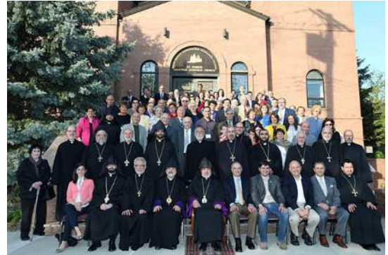
Delegates and guests at the National Representative Assembly, May 2016.

The Prelate went on to discuss the various areas of service including in our individual life, organizational life, collective Armenian life, and church life.