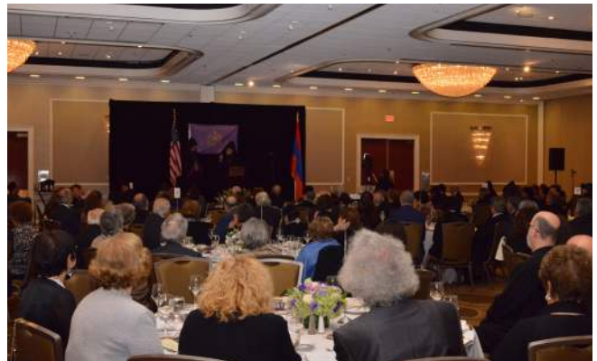
Guests listen attentively to the Vicar's presentation.

Յարատեւութեան նոյն ոգիով սողորուած, հայրապետութեան երկու տասնամեակներուն ընթացքին առանց վարանման կամ տեղատուութեան, յաղթահարելով քաղաքական, նիւթական եւ այլ բազմաթիւ