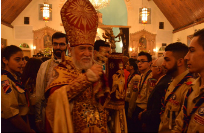
His Holiness leaves the church after the Divine Liturgy with an honor guard of scouts.