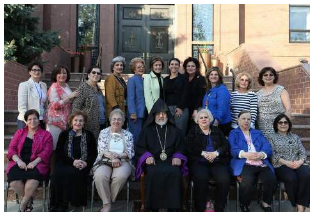
Archbishop Oshagan with the delegates to the National Association of Ladies Guilds Conference

With total agreement the Yeretzgeens said, "When one attends a conference such as this, there is nothing more gratifying than to depart feeling energized, enlightened, encouraged, motivated, inspired, refreshed and ready to return to our communities with a renewed spirit in Jesus Christ."