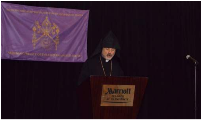
Bishop Anoushavan Tanielian, Vicar General of the Eastern Prelacy, presented the Keynote Address in honor of the life and service of His Holiness Aram I. English Translation of this keynote address is on the Prelacy web page. ( www.armenianprelacy.org )

Եւ այսօր, քսան տարիներ ետք եկած ենք հաւաքական կերպով վկայելու ծառայութիւնը մարմնաւորող Աստուծոյ Հաւատարիմ ծառայի մը, եւ մեր երախտագիտութիւնը յայտնելու բանիւ ու գործով ապրուած կեանքի մը, որ տրուած է ո՛չ միայն իր անձին, իր Միաբանութեան, իր Ազգին ու Եկեղեցիին, այլ անդրանցներով պատկանելիութեան նեղ սահմանները, գործած է ի խնդիր Քրիստոնէութեան եւ միջ-կրօնական յարաբերութեանց բարւոք զարգացման: Կեանք մը որուն մասին կարելի է անդրադառնալ Հատորներով, սակայն ինծի տրամադրուած սուղ ժամանակի սահմաններուն մէջ պիտի փորձեմ ըստ կարելոյն համապարփակ ձեւով ներկայացնել հական արժանիքներն ու իրագործումները 20-րդ դարը 21-րդ դարուն կամընդ բազմատաղանդ այս հոգեւորականին՝ Ն.Ս.Օ.Տ.Տ. Արամ Ա. Մեծի Տանն Կիլիկիոյ Կաթողիկոսին, որ աստուածատուր իր շնորհներուն ընդմէջէն փառքով ու պատիւով պայծառացուց Հայց. Եկեղեցին, ընդհանրապէս, եւ Շնորհալիներու Գահը, ի մասնաւորի, զայն անգամ մը եւս լուսարձակի տակ բերելով որպէս բաբախուն սիրտը Հայ իրականութեան, որ թէկուզ համեստ, սակայն իր անուրանալի ներդրումը ունեցած է եւ կը շարունակէ ունենալ միջազգային կեանքին մէջ: