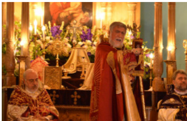
His Holiness delivers the sermon at Sts. Vartanantz Church in Ridgefield, NJ

The Catholicos delivered a passionate sermon based on the Gospel reading of the day—the parable of the poor widow. His Holiness emphasized the difference between greed and need and referred to the parable of the poor widow in the Gospel of Mark, who offered two small copper coins. His Holiness echoed the voice of the parable saying that the poor widow has put in more than all those who are contributing to the treasury, because they contributed out of their abundance,