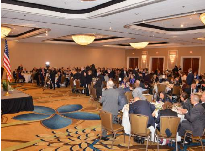
A scene of the banquet in Teaneck, New Jersey.

Իր բոլոր պատգամներուն մէջ, Վեհափառ Հայրապետը յանախ կը շեշտէ որ՝ երիտասարդութիւնը ոչ