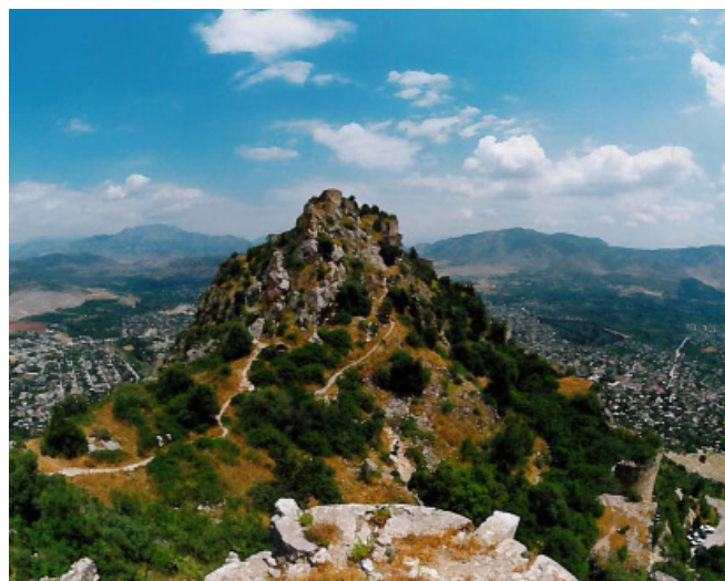
A view of Sis in Cilicia where the Holy See of Cilicia was located for centuries. The Catholicosate filed a lawsuit in the Turkish Constitutional Court to regain ownership.

On April 28, 2015, the Catholicosate of the Great House of Cilicia, with the leadership of Catholicos Aram, filed a lawsuit in the Turkish Constitutional Court to regain ownership of the historic headquarters of the Church, including the Catholicosate, the Monastery, and the Cathedral of Saint Sophia located in Sis (present-day Kozan), in the Adana Province of Turkey. In this landmark case, the Catholicosate claims that it retains ownership rights over its historic Seat and that under international law and the 1923 Lausanne Treaty, the government of Turkey has an obligation to return this property so that it may be restored and used as it had been for more than one thousand years as a place of religious worship. His Holiness Aram’s commitment to the case is based on his deep desire to convey “more than memory” to the coming generations by securing in a very concrete way the return of the Armenian nation’s spiritual headquarters and heritage.