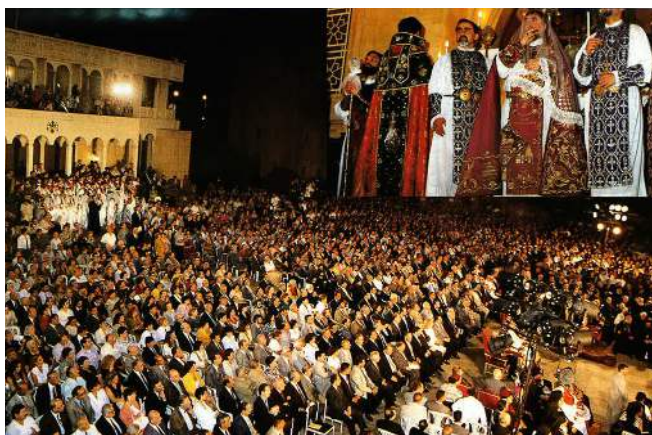
The consecration and enthronement took place in the courtyard of the Catholicosate's complex, in front of the Cathedral of St. Gregory the Illuminator, on July 1, 1995.

He was ordained a celibate priest in 1968 and earned the title of Vartabed (Doctor of the Armenian Church) in 1970. In 1979, after serving for one year as locum tenens , he was elected Prelate of the Armenian Orthodox community in Lebanon. The next year he received his Episcopal ordination. His tenure as Prelate of Lebanon coincided with the Lebanese Civil War—some of the most challenging years ever faced by the Armenian community of Lebanon. During this time and after, he reorganized parishes and schools, restructured and reactivated church-related institutions, and renewed community leadership.