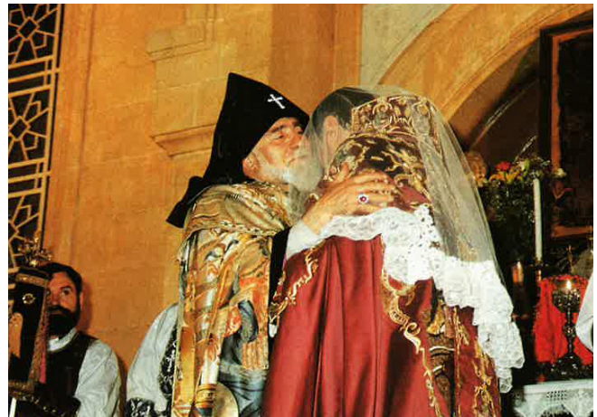
His Holiness Karekin I of Etchmiadzin embraces Catholicos Aram.

His ecumenical involvement reached its zenith when in 1983 he was elected to serve as a member of the Central Committee of the World Council of Churches (WCC) at the Vancouver Assembly. This was followed by his election as Moderator of the Central and Executive Committees at the Canberra Assembly in 1991, the highest position of this