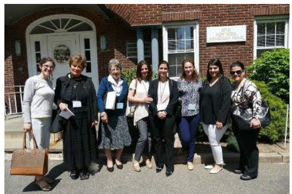
The Yeretzeens at the Armenian Home in Flushing, New York.